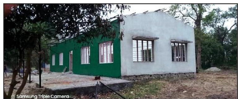
Samsung Triple Camera

सहभागी भएको बुझिएको छ । ५० शैयाको निर्माण गरिएको क्वारेन्टाइनमा अहिले ८५ जनाको संख्यामा मानिसहरु बसेका छन् । सुत्ने, खाने व्यवस्था कमजोर रहेको भन्दै उनीहरूले बेला बेलामा विरोध गर्दै आइरहेका छन् । पुष्टि भएको जानकारी आउने बित्तिकै संक्रमित पुरुषलाई छुट्टै व्यवस्थापन गरिएको संयोजक साहले जनाए । गौर नगरपालिकामा पुष्टि भएकाहरु भारतबाट