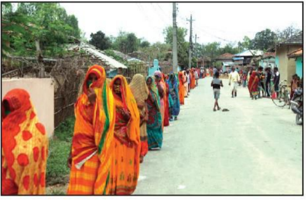
परिवारलाई राहत वितरण गरिएको छ ।