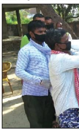
जारी गरेको लकडाउनको कारण प्रभावित भएका अतिविपन्न परिवारहरूलाई तोकैको मापदण्ड अनुसार राहत स्वरूप खाद्यान्न समाग्री वितरण गरिएको हो ।

विश्वव्यापी महामारीको रयमा फैलिरहेको कोरोना भाइरस (कोभिड-१९) संक्रमणको जोरिखम न्युनिकरण गर्न सरकारले