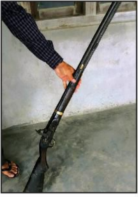
बाराको जनाएको छ । त्यस्तै कोल्हबीको काटा टोलबाट

सिकारीको खोजी कार्य भईरहेको डिभिजन वन कार्यालय