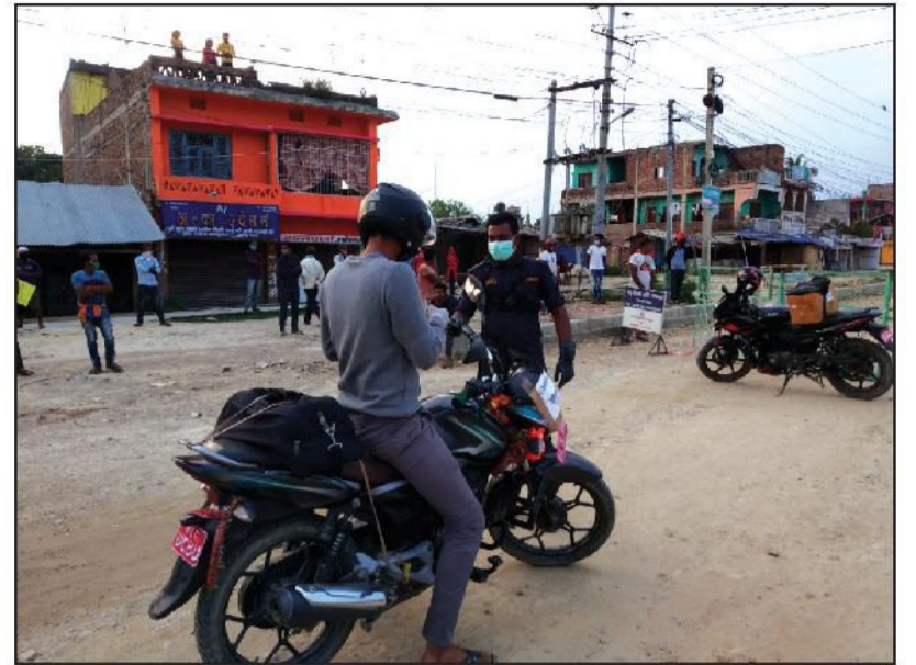
बस्न आग्रह गर्दा पनि अटेर गर्नेहरूको लागि यस्तो कदम चालेको बताए । उनले ४ बजे सडकमा बिना काम निस्कने र लकडाउन आदेशको उल्लंघन गर्नेलाई सम्बन्धित स्थल मे नियन्त्रणमा लिने र होल्ड गर्ने अभियान चलाएको बताए ।

इप्रेसका महेन्द्रनगरका इन्चार्ज प्रहरी निरीक्षक नायकका अनुसार आवश्यक काम ४ बजे भित्र सकाएर चार बजे पश्चात लकडाउनलाई पूर्णरूपले पालना गरी घर मे सुरक्षित भई