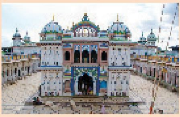
अत्यन्त गरेको पापबाट जलकपुरधाममा मुक्ति पाउन सकिन्छ । जलकपुरधाममा गरेको पापबाट मुक्ति पाउने स्थान अत्यन्त छैन ॥