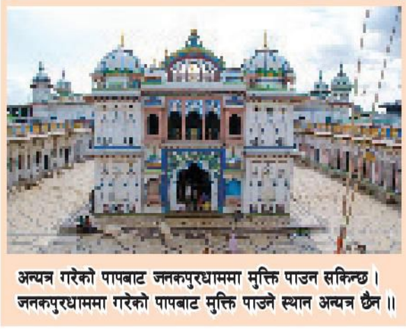
अन्यत्र गरेको पापबाट जनकपुरधाममा मुक्ति पाउन सकिन्छ । जनकपुरधाममा गरेको पापबाट मुक्ति पाउने स्थान अन्यत्र छैन ॥