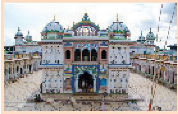
अत्यन्त गरेको पापबाट जनकपुरधाममा मुक्ति पाउन सकिन्छ । जनकपुरधाममा गरेको पापबाट मुक्ति पाउने स्थान अत्यन्त छैन ॥