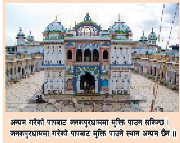
अन्त्यन गरेको पापबाट जलकपुरधाममा मुक्ति पाउन सकिन्छ । जलकपुरधाममा गरेको पापबाट मुक्ति पाउने स्थान अन्त्यन छैन ॥