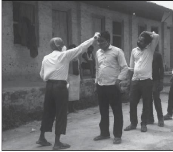
मा हस्ताक्षर गराएर जिम्मा गते स्वाब संकलन गरि पिसिआर टेस्टका लागि राष्ट्रिय जनस्वास्थ्य प्रयोगशाला, टेकु काठमाण्डु पठाइएको थियो ।