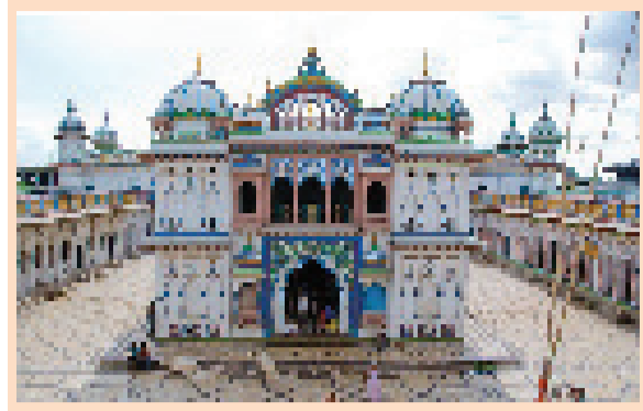
अन्त्यत्र गरेको पापबाट जनकपुरधाममा मुक्ति पाउन सकिन्छ। जनकपुरधाममा गरेको पापबाट मुक्ति पाउने स्थान अन्त्यत्र छैन ॥