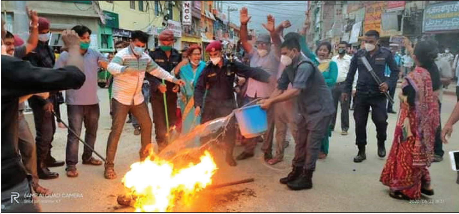
विभेदपूर्ण नागरिकता विधेयक फिर्ता गर । जनता समाजवादी पार्टी धनुषाका कार्यकर्ताहरू सोमबार साँझ जनकपुरधामको भानुचोकमा प्रधानमन्त्री केपी शर्मा ओलीको पुतला दहन गरेका छन् । सात वर्षपछि नागरिकता दिने विधेयकको विरोधमा जनता समाजवादी पार्टी आन्दोलित भएको छ ।