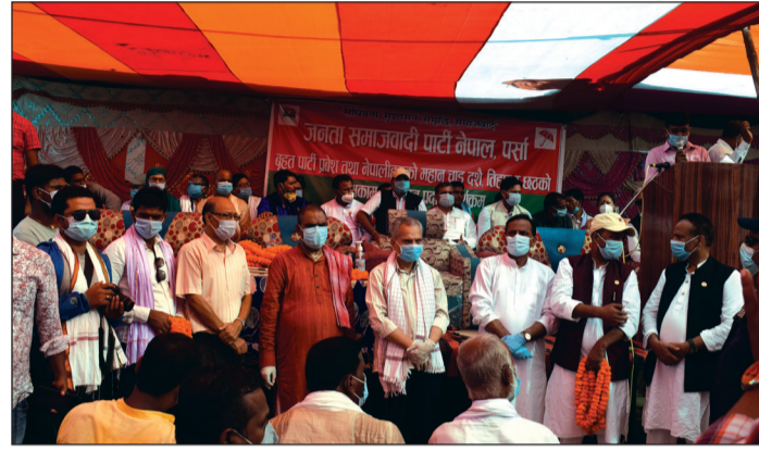
कांग्रेस र कम्युनिष्ट पार्टी मधेशी र पहाडका जनजाति विरोधी भएको आरोप लगाए।

कोरोनालाई नियन्त्रण गर्न असफल भएको छ। अध्यक्ष यादवले मधेशी जनजातिहरूको अधिकार पुर्ण रुपमा प्राप्त नभएको उल्लेख गर्दै त्यसका लागि आफुहरूको आन्दोलन जारी रहेको बताए। 'तराई र पहाडका सबै क्रान्तिकारी नेताहरू जसपाको सिंगो थलोमा गोलबद्ध भएका छन् 'उनले भने, आउने दिनमा मधेशी जनजातिले मुलुकको केन्द्रिय सत्ता प्राप्त गरेरै छाड्ने छन्। जसपाका वरिष्ठ नेता एवम पुर्व प्रधानमन्त्री बाबुराम भट्टराईले नेपालको