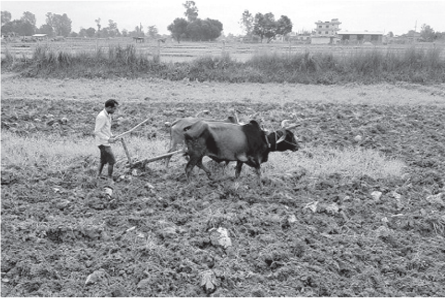
रोपाई गर्नका लागि खेत जोत्दै स्थानिय कृषक । यसपाली समयमै वर्षा शुरु भएसँगै यहाँका किसानलाई रोपाई गर्नमा चटारो छ ।