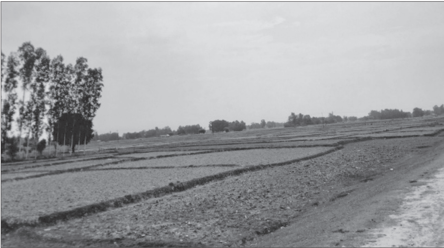
साउनका सुस्मा पनि पानी नपरेका कारण बर्दिया, गुलरिया नगरपालिका-११, गणेशपुरमा धान रोप्न नपाएर बाँधो रहेको किसानका जमिन ।