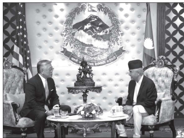
लागि धन्यवाद दिँदै उच्चस्तरको आर्थिक संलग्नताको अपेक्षासमेत गर्नुभएको थियो । यसअघि शुक्रवारे सहायक

प्रधानमन्त्री निवास बालुवाटारमा शुक्रवार भएको भेटमा उहाँहरूबीच नेपाल-अमेरिका मैत्रीपूर्ण र सहयोग सम्बन्धका विविध आयामबारे विचार आदानप्रदान भएको परराष्ट्र मन्त्रालयले जनाएको छ । सो अवसरमा प्रधानमन्त्री देउवाले नेपाललाई अमेरिकाको निरन्तर विकास सहयोगका