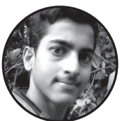
रोशन म्हा जनकपुर -१७, मन्हरपुर

समय अस्त्य ब्यस्त मै थियो । प्रयास उथिल्ले गुमानमा थियो.. प्रबल मै छ त्यो फेरियेको मुहार नकिन मन मने फेरिदे छ त्यो मुहार । समय नै छन्द हो ; समय मै फेरियेको त्यो मुस्कान हो । हावाको बेग सडै रितियेको त्यो मन मेरो हावा मै उडेको प्यल हो त्यो मुस्कान मेरो । नजान किन गुमिदै छ त्यो मुस्कान मेरो ; समयले फेरियेको प्रयास मेरो । अस्तित्व मै बिलिन त्यो चाहनाहरु ; अस्तित्व मै गुमाउँदै छन ती पाइला हरु । फेरिदे त्यो बाटो र गुमाउँदै ती सपना उथिल्लिन छ ती चाहना । प्रकाश को सक्षाम प उभैरुनु छ फेरि ती सपना हरु ।