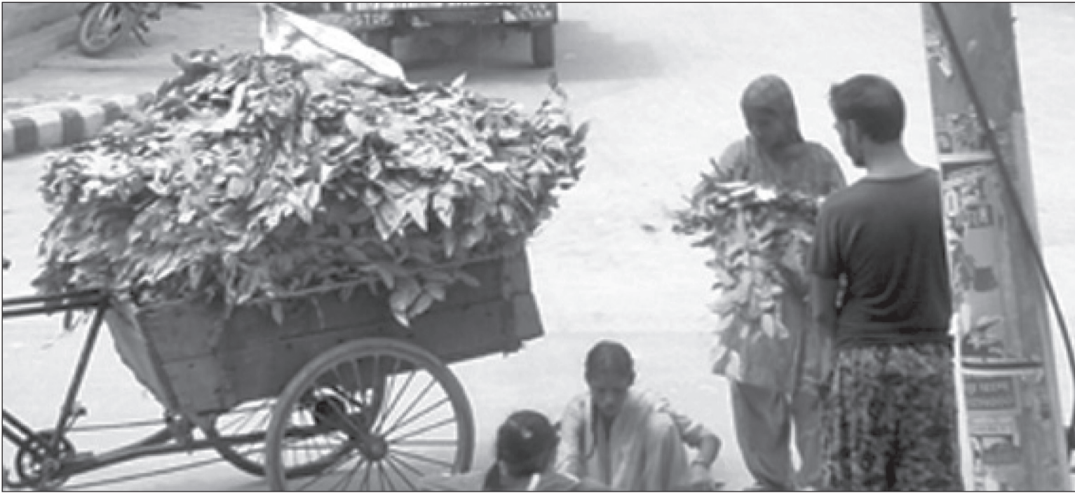
महोत्तरी जिल्लाको सदरमुकाम जलेश्वरको महेन्द्र चोकमा तेजपता बिक्री गर्दै महिला।