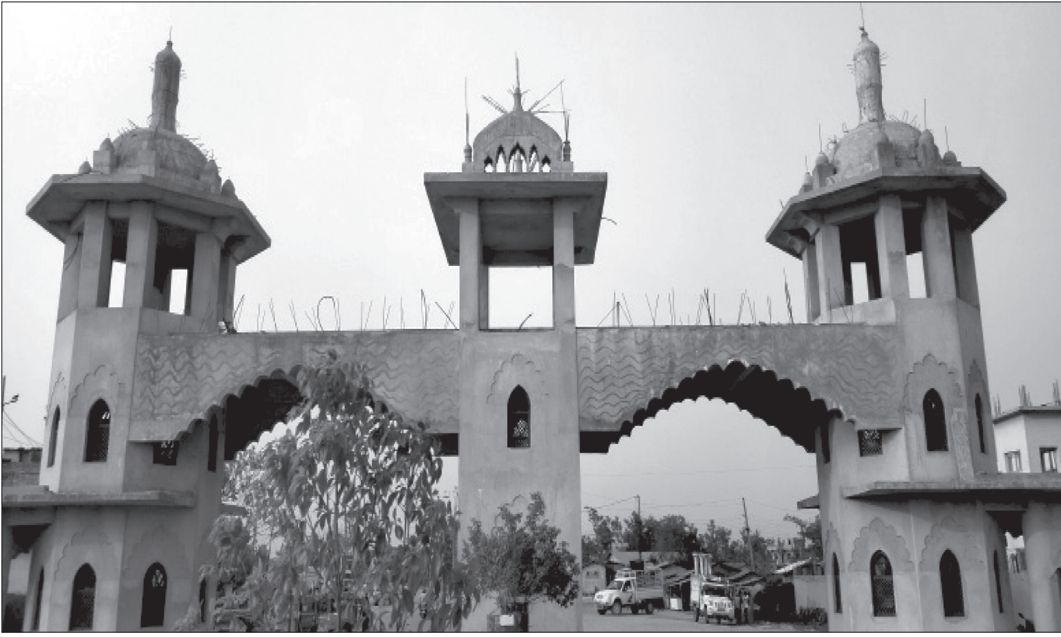
जलेश्वर । महोत्तरीको मूल भन्सार कार्यालय जलेश्वरमा नेपाल- भारत सीमा नजिकै नेपालतर्फ बन्दै गरेको आकर्षक एवं कलात्मक प्रवेशद्वार ।