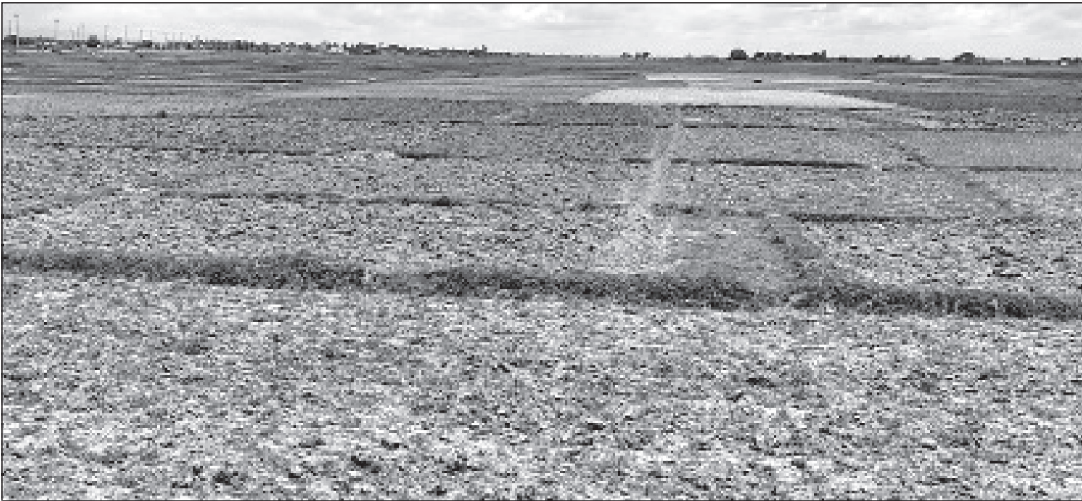
बाँधे रहेको धान खेत