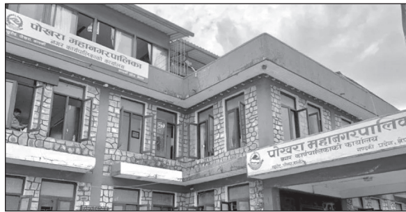
किसानलाई नगद अनुदान प्रदान गरिँदै आइएको छ ।