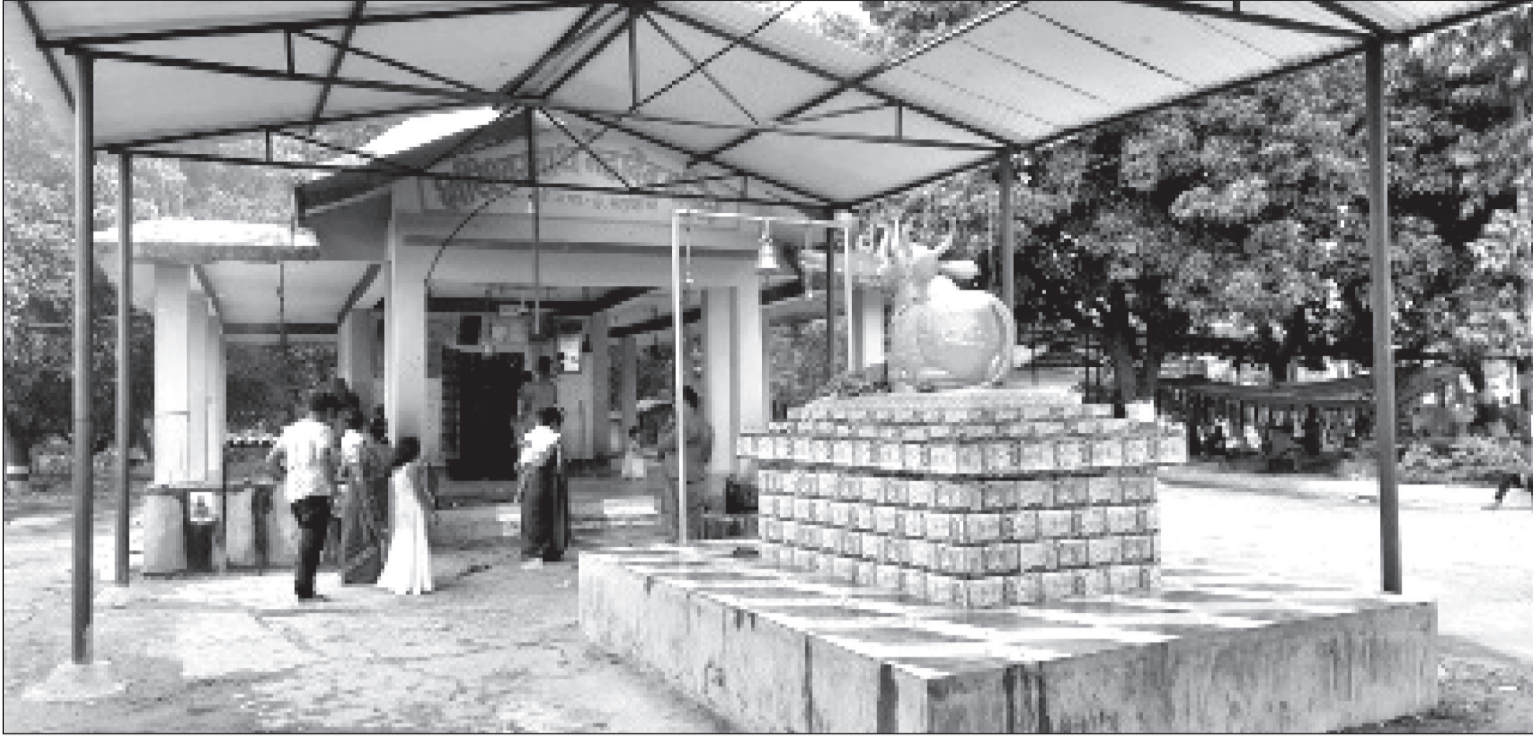
हिन्दु नेपाली महिलाहरूले महादेवको पूजा आराधना गरी मनाउने तीज पर्वको अवसरमा धनुषाको क्षीरेश्वरनाथ महादेव स्थान मन्दिर (कपाल) भन्नेको मान्यता रहेको यस क्षीरेश्वरनाथ महादेव मन्दिरमा साउने सोमबार, तीज, महाशिवरात्रिलगायतमा मेला लामो गर्दछ।