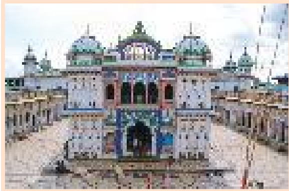
अन्यत्र गरेको पापबाट जनकपुरधाममा मुक्ति पाउन सकिन्छ । जनकपुरधाममा गरेको पापबाट मुक्ति पाउने स्थान अन्यत्र छैन ॥