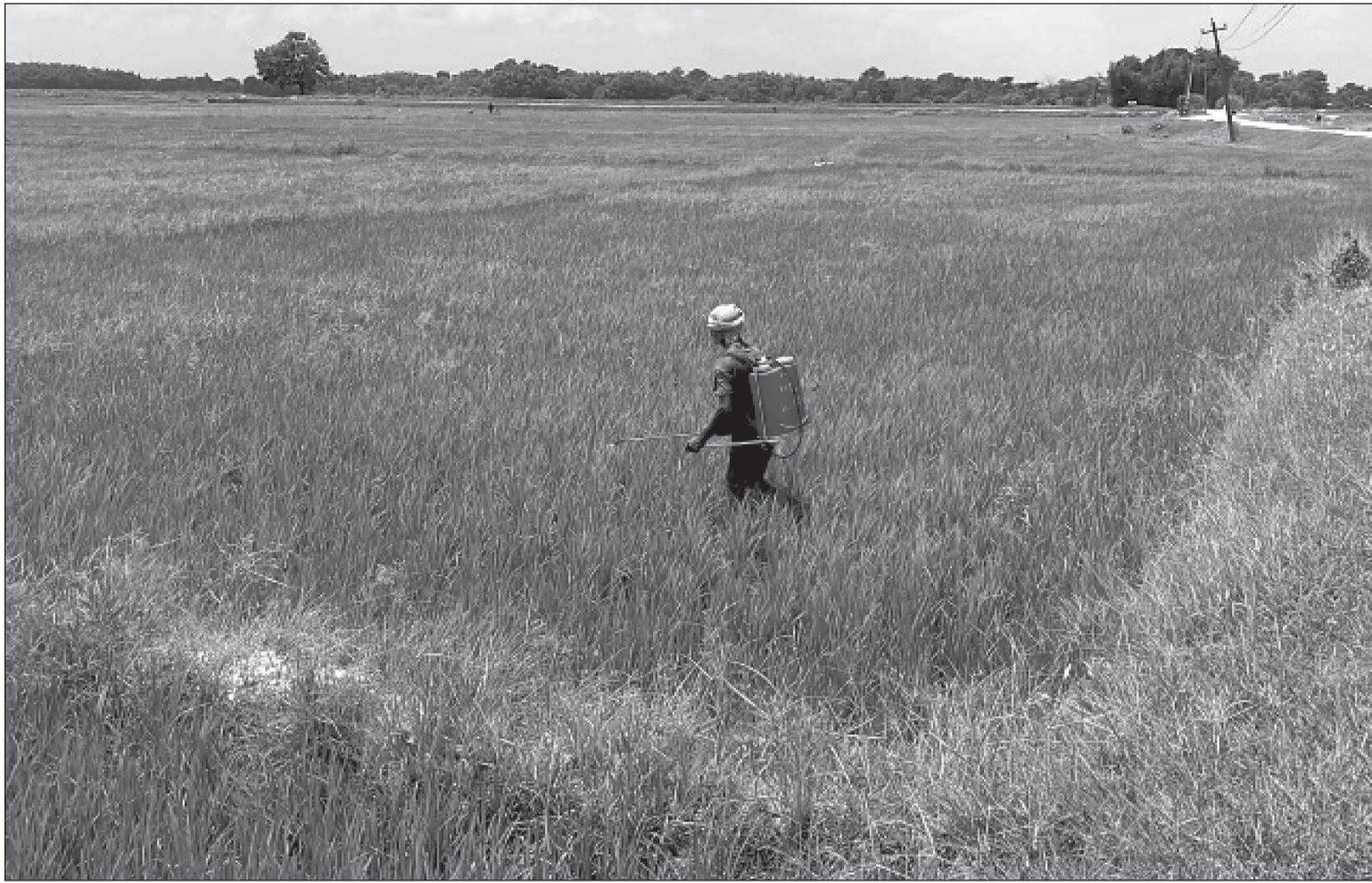
धानमा औषधी छिकिँदै किसान : सप्तरीको तिरहुत गाउँपालिका-१ स्थित त्रिकोलमा कीरा लागेको धानमा औषधी छिकिँदै किसान ।