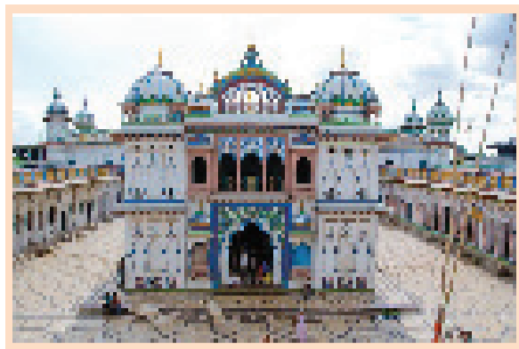
अन्वय गरेको पापबाट जनकपुरधाममा मुक्ति पाउन सकिन्छ । जनकपुरधाममा गरेको पापबाट मुक्ति पाउने स्थान अन्वय छैन ॥