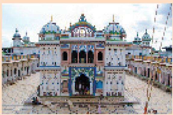
अन्त्य गरेको पापबाट जनकपुरधाममा मुक्ति पाउन सकिन्छ । जनकपुरधाममा गरेको पापबाट मुक्ति पाउने स्थान अन्त्य छैन ॥