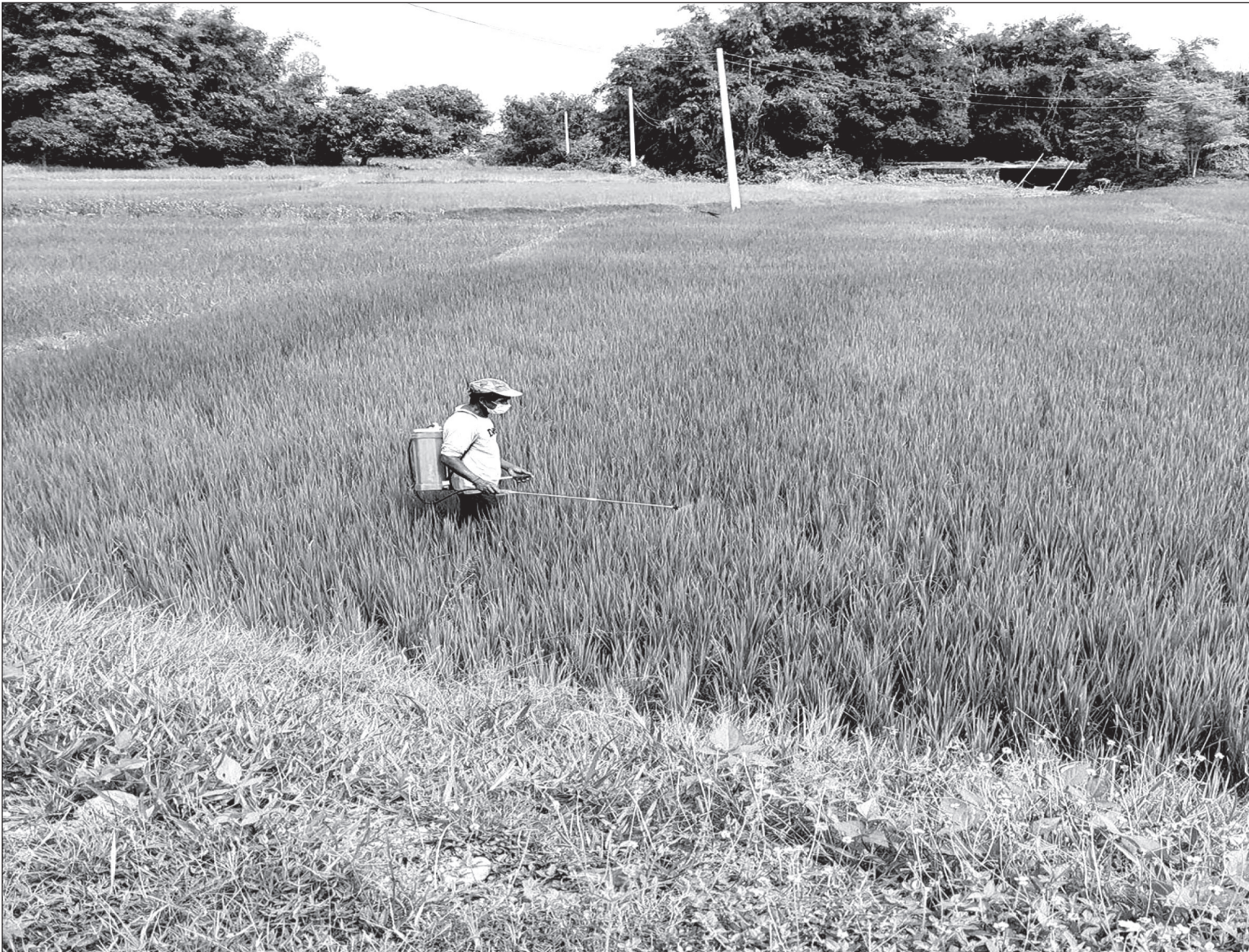
धानबालीमा किटनाशक औषधी छिकिदै किसान : राजविराज । सप्तरीको अमिसाईर कृष्णासवरण गाउँपालिका-४ स्थित बनौलीमा धान बालीमा लामे करीबाट जोगिनका लागि किटनाशक औषधि छिकिदै गरेको किसान ।