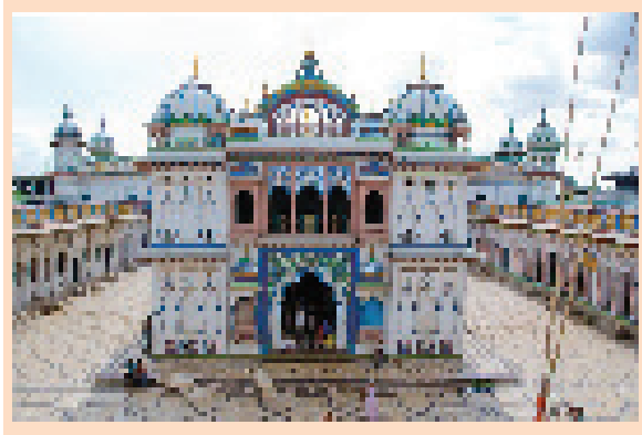
अन्यत्र गरेको पापबाट जनकपुरधाममा मुक्ति पाउन सकिन्छ । जनकपुरधाममा गरेको पापबाट मुक्ति पाउने स्थान अन्यत्र छैन ॥