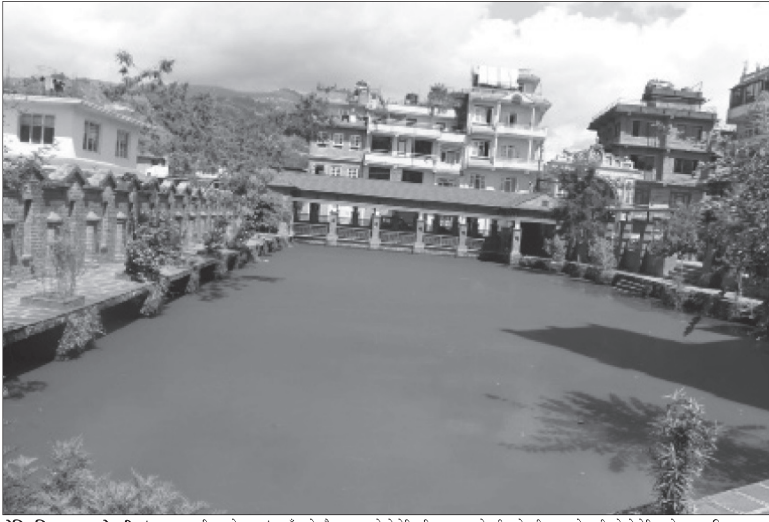
ऐतिहासिक कला पोखरी: शंखारपुर नगरपालिकाको वडा नं ६ सौखुको भोष्वाखामा रहेको ऐतिहासिक कला पोखरी। पोखरीमा भएको पानी पहिलो देखिएको छ।