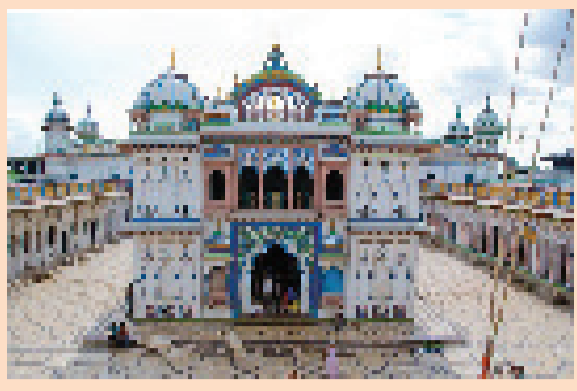
अन्त्य गरेको पापबाट जनकपुरधाममा मुक्ति पाउन सकिन्छ । जनकपुरधाममा गरेको पापबाट मुक्ति पाउने स्थान अन्त्य छैन ॥