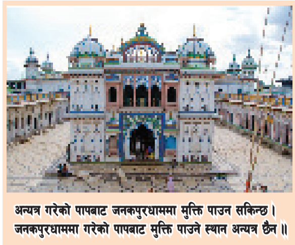
अन्त्य गरेको पापबाट जनकपुरधाममा मुक्ति पाउन सकिन्छ । जनकपुरधाममा गरेको पापबाट मुक्ति पाउने स्थान अन्त्य छैन ॥