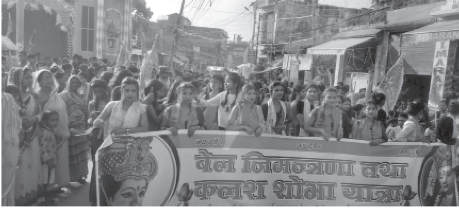
कलश शोभा यात्रामा सहभागीहरू: महोत्तरीको जलेश्वरमा दुर्गा पूजाको अवसरमा शनिबार आयोजित बेल निमन्त्रणा तथा कलश शोभा यात्रामा सहभागीहरू।