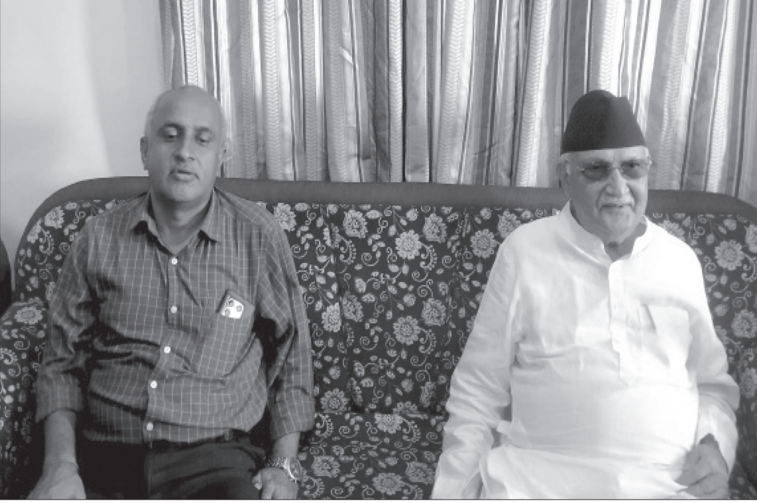
एमाले अध्यक्ष ओली: नेकपा (एमाले)का अध्यक्ष एवं पूर्वप्रधानमन्त्री केपी शर्मा ओली शनिबार विराटनगरमा विमानस्थलमा मुलुकको समसामयिक विषयमा सञ्चारकर्मीहरूसँग कुराकानी गरेका थिए ।