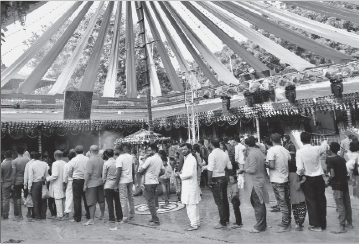
राजदेवी मन्दिरमा लामबद्ध भक्तजन । जनकपुरधामको रामचोकस्थित माता राजदेवी मन्दिरको दर्शन गर्न लामबद्ध भक्तजन ।