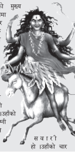
सवारी हो उहाँको चार

थाल्छन् । त्यसकारण दानव, दैत्य, राक्षस र भूत-प्रेत उहाँको स्मरणले नै भाग्छन् । उहाँले ग्रह बाधाहरूलाई हटाउनु हुन्छ । आग्नि, जल, जंतु, शत्रु र रात्रि भय उहाँको स्मरणले नै हट्छ । माता कालरात्रीको कृपालो भक्त सबै प्रकारको भयबाट मुक्त हुन्छन् । माता कालरात्री सर्वदा कल्याणी हुनुहुन्छ । कालरात्री माताको साधकहरू सदैव भय भुक्त भएर मध्य राती(काल रात्री)मा उहाँको अराधना गर्छन् । माता कल्याणीको भक्ती अराधनाले सम्पूर्ण रूपमा भक्तजनको मनकामना पूर्ण हुन्छ । वडा दशैँमा दूर्गा भवानीको सातौँ दिनको पूजालाई सर्वाधिक महत्व दिएको हुन्छ । सो दिन दूर्गा मन्दिरहरूमा विशेष पूजा गरिन्छ । कतिपय स्थानमा सप्तमी र अष्टमीको दिन कालरात्री माताको पूजाको अवसरमा बली प्रदानपनि गरेको पाईन्छ ।