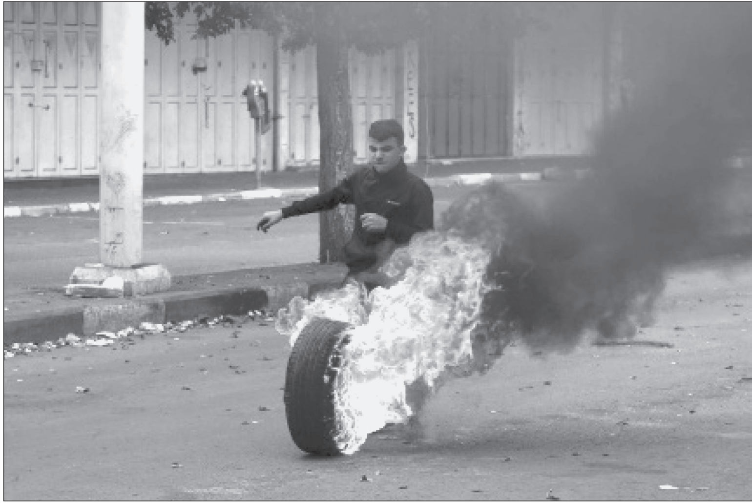
मध्यपूर्व-हेब्रोन-संघर्षहरू: वेस्ट बैंकको हेब्रोन सहरमा इजरायली सैनिकहरूसँग भडप हुँदा एक प्यालेस्टाइन प्रदर्शनकारीले टायर जलाए।