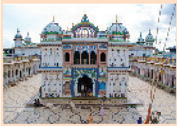
अन्यत्र गरेको पापबाट जनकपुरधाममा मुक्ति पाउन सकिन्छ। जनकपुरधाममा गरेको पापबाट मुक्ति पाउने स्थान अन्यत्र छैन।