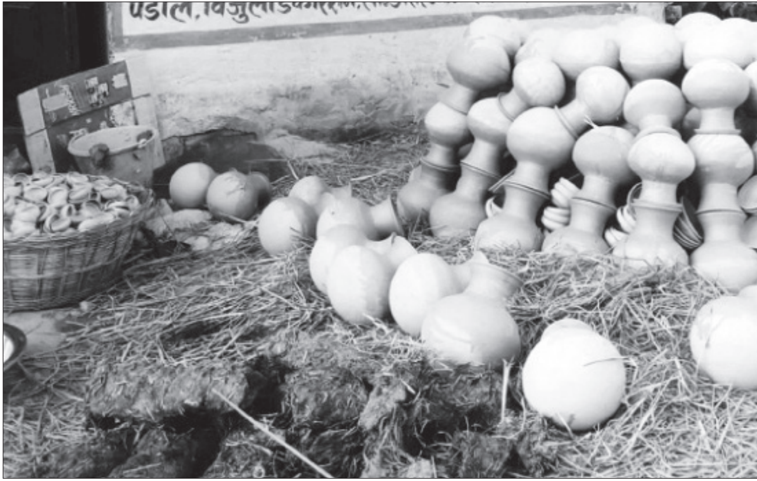
धाममा सुकाइएको माटोबाट निर्मित सामग्री : धाममा सुकाइएको माटोबाट निर्मित दियो, वैठोलगायत सामग्री ।