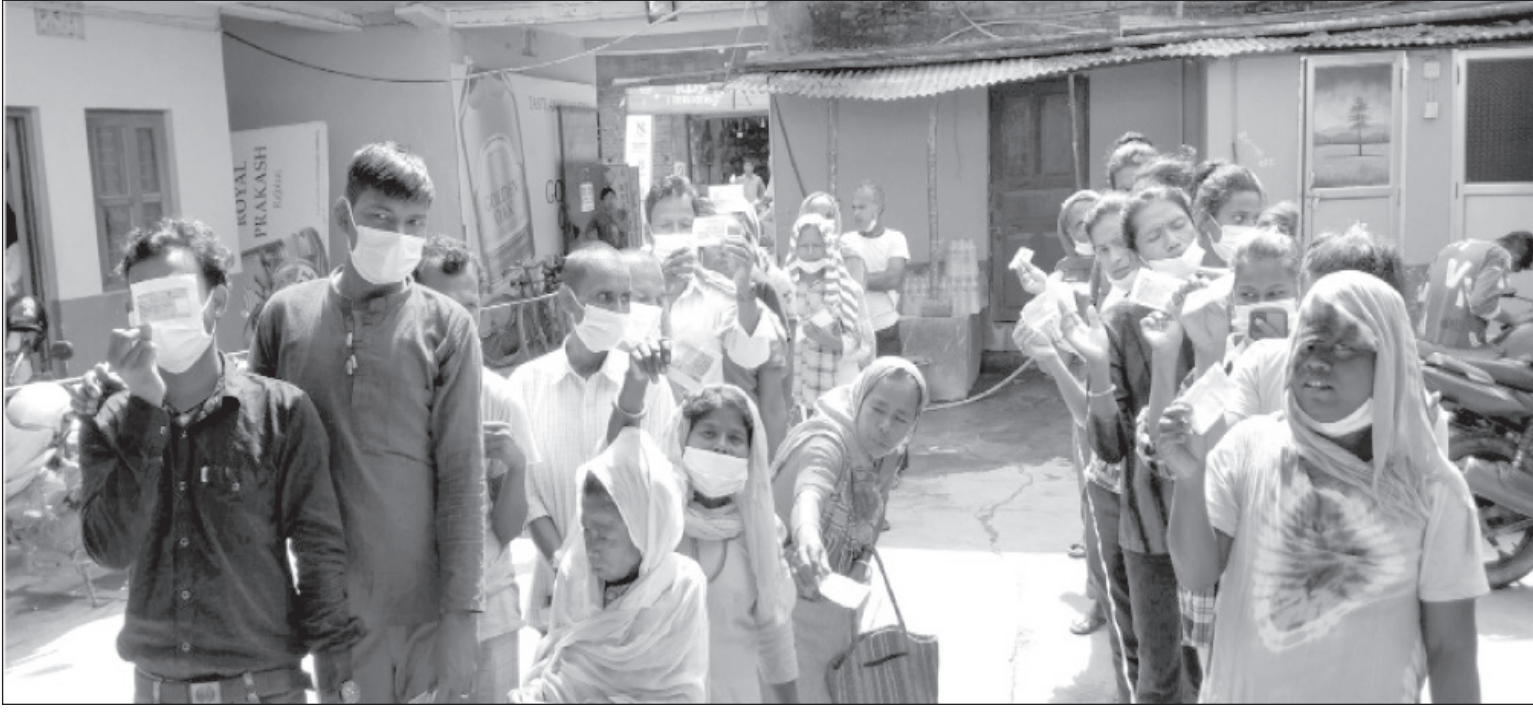
जमुना मतदानको अभ्यास : आगामी मङ्सिर ४ गते हुने प्रतिनिधिसभा र प्रदेशसभाको प्रत्यक्ष निर्वाचनमा बढेर मत कम गर्न र मतदाता शिक्षा प्रभावकारी बनाउन बिहीबार सप्तरीको राजविराजमा गरिएको नमूना मतदानको अभ्यासका लागि लामबद्ध नागरिक ।