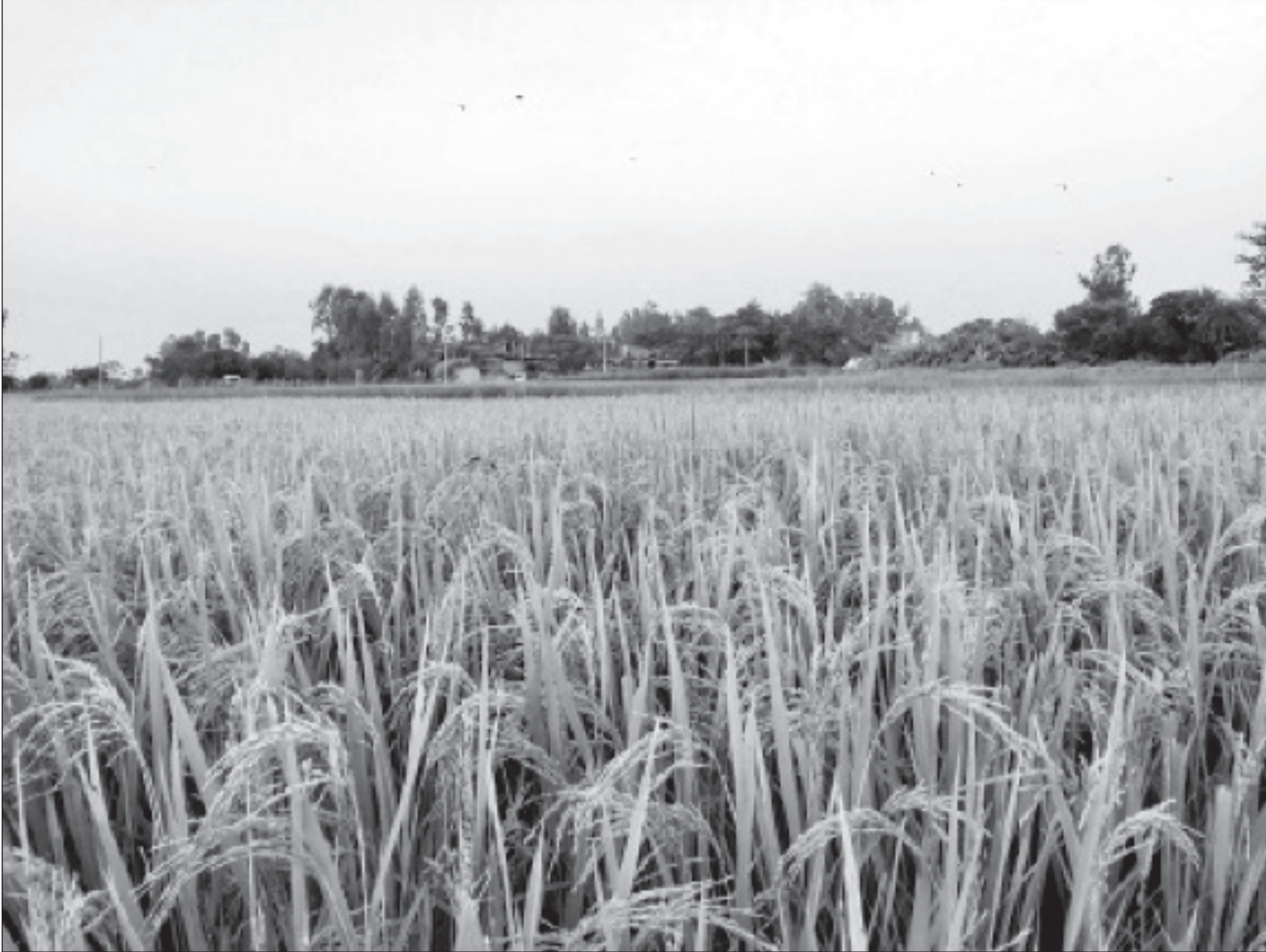
लहलहे भुलेको धान : विदेह नगरपालिका-८ बाँकेमा देखिएको लहलहे भुलेको धान खेत ।