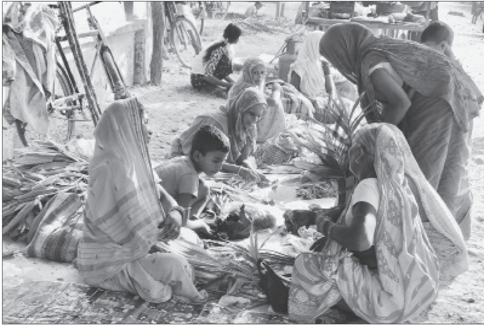
छठ किनमेल : छठका लागि शुरुबार पूजा सामग्री किन्दै महिलाहरु ।