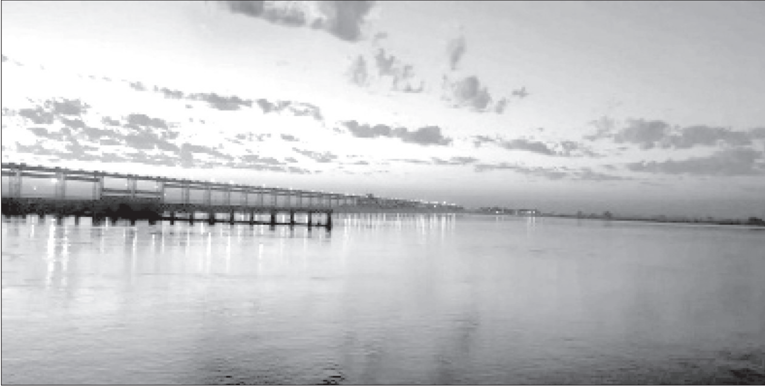
सूर्यास्तमा देखिएको कोशी पुल : कोशी नदिको ब्यारेजमा साँझपख सूर्य अस्ताउँदै गर्दा देखिएको मनोरम दृश्य।