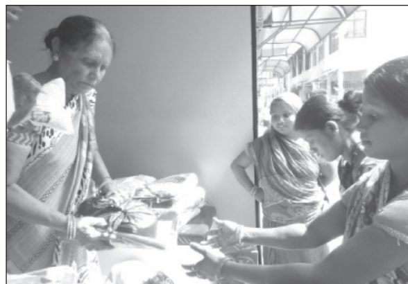
वितरण गरिएको संचालिका देवीले जानकारी दिइन ।

आफ्नो नातिनी (छोराको छोरी) विरामी भइरहदा उनको स्वास्थ्य लाभको कामनासहित छठ सामग्री