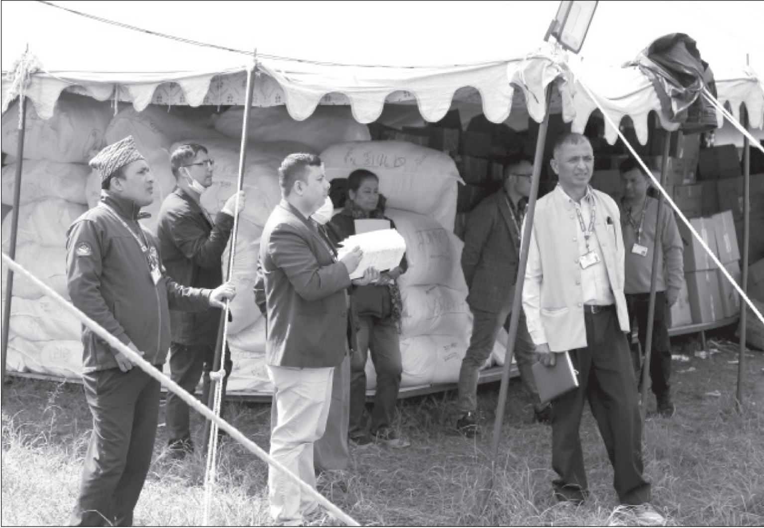
निर्वाचनको सामग्री ढुवानी गरिँदै : मंसिर ४ गते हुने प्रतिनिधिसभा र प्रदेशसभा सदस्यका निर्वाचनका लागि विभिन्न जिल्लामा निर्वाचन सामग्री पठाउन गाडीमा लोड गर्दै आयोगका कर्मचारीलगायत कामदार ।