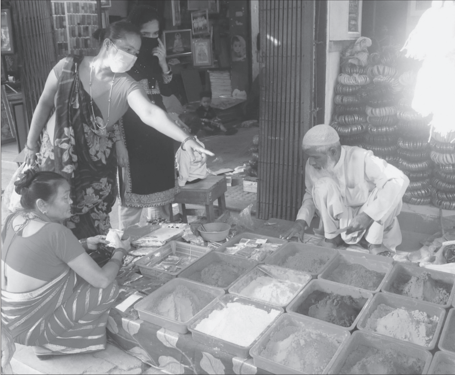
टीका बिक्री: भाइ टीकाका लागि सप्तरङ्गी टीका बिक्री गर्दै बिक्रेता ।