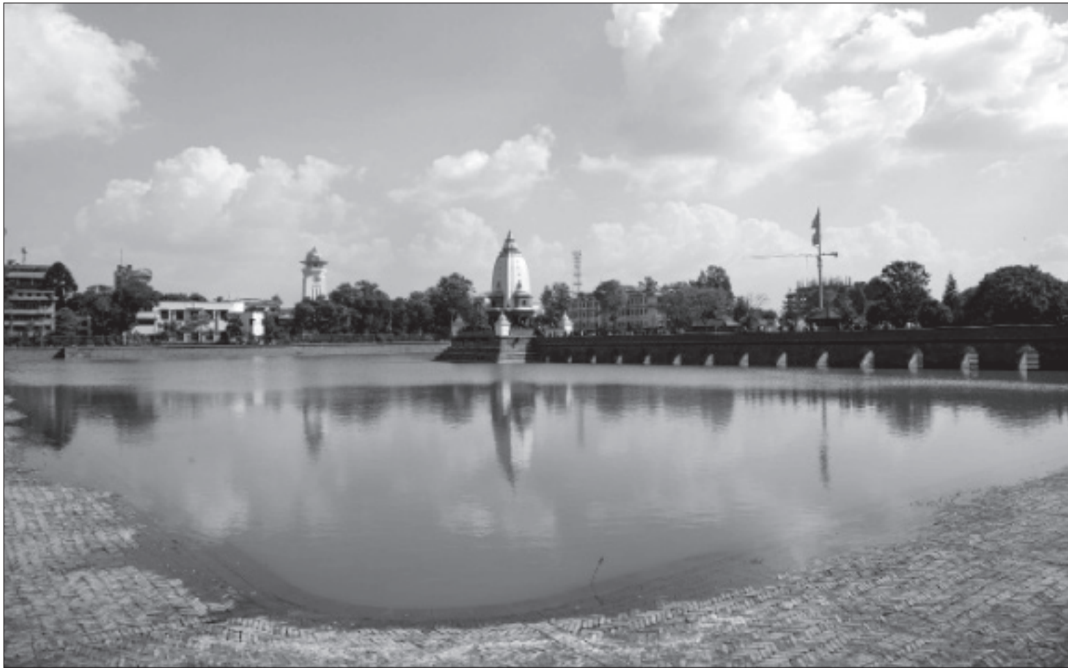
रानीपोखरीस्थित बालगोपालेश्वर मन्दिर: काठमाण्डुको रानीपोखरीबीचमा रहेको बालगोपालेश्वर मन्दिरमा आएका सर्वसाधारण नागरिक ।