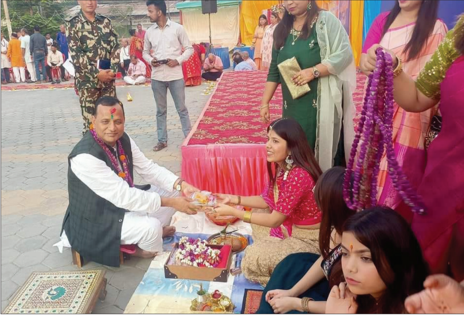
टीका ग्रहण गर्दै मुख्यमन्त्री: वीरगञ्जमा आयोजना गरिएको सामूहिक भाइटीका कार्यक्रममा टीका ग्रहण गर्दै मधेश प्रदेशका मुख्यमन्त्री लालबाबु राउत।