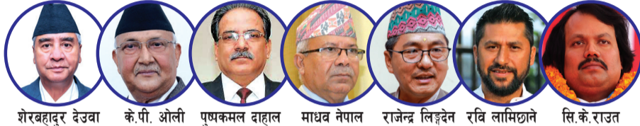
शेरबहादुर देउवा के.पी. ओली पुष्पकमल दाहाल माधव नेपाल राजेन्द्र लिङ्गदेन रवि लामिछाने सि.के. राउत

टुडे समाचारदाता जनकपुरधाम । प्रतिनिधि र प्रदेश सभाको मतगणना जारी रहेको बेला मधेशबाट नेतृत्व हुने जनता समाजवादी पार्टी (जसपा), लोकतान्त्रिक समाजवादी पार्टी (लोसपा) र जनमत पार्टीले 'श्रेस होल्ड' कटाउन नसके संकेत देखिएको छ ।