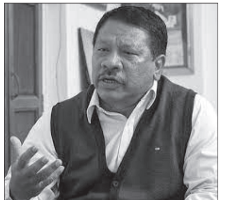
प्रचारप्रसार कार्यक्रममा उहाँले भन्नुभयो । रासस

“संसद्को दुई कार्यकाल संविधान लेखनमा गयो, एक कार्यकाल संविधान जोगाउने लाग्यो, अब कार्यान्वयनमा लैजाउनुपर्ने”, शनिबार भएको