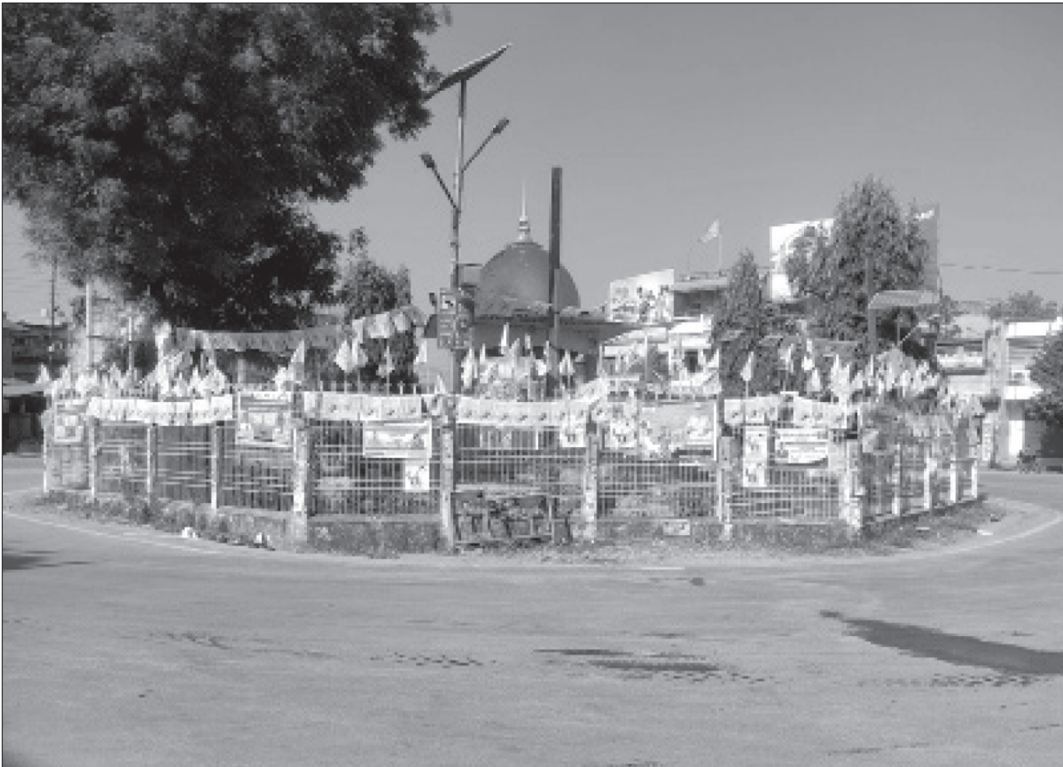
निर्वाचन आचार सङ्घीयतालाई दृजिया उडाउँदै सप्तरीको राजविराजको मुटुमै रहेका गजेन्द्र चोकमा भुइँड्याएको विभिन्न दलका चुनाव प्रचार। यो चोक मधेसका स्व नेता गजेन्द्रनारायण सिंहको नामबाट स्थापना गरिएको छ।