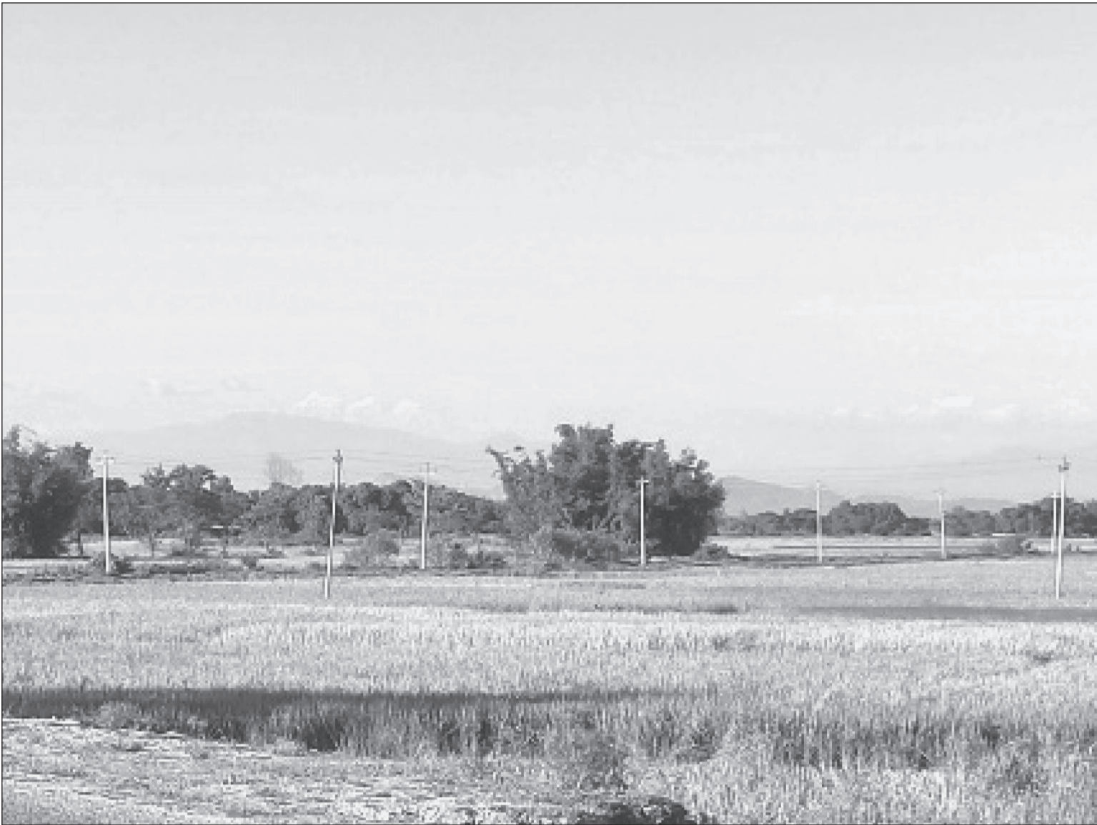
सपारीको तिलाठी कोइलाडी गाउँपालिका वडा नं १ स्थित तिलाठी गाउँबाट जिल्लाको उत्तरी भेगमा देखिएको तराई र पहाडको सुन्दर दृश्य ।