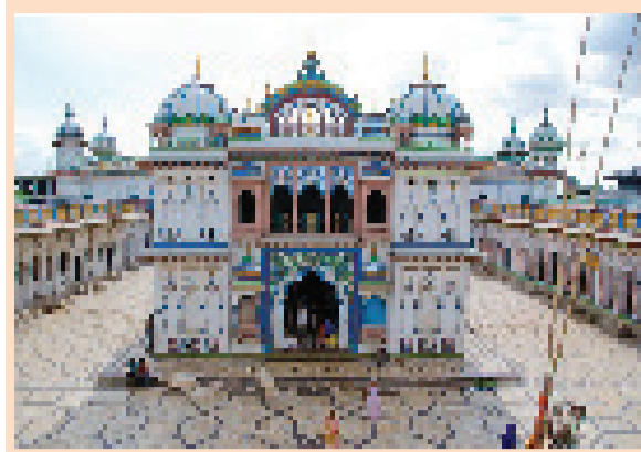
अन्वय गरेको पापबाट जनकपुरधाममा मुक्ति पाउन सकिन्छ । जनकपुरधाममा गरेको पापबाट मुक्ति पाउने स्थान अन्वय छैन ॥