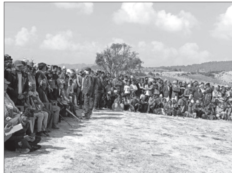
डडेल्धुराको अजयमेरु गाउँपालिकाको भद्रपुरमा शनिबार प्रधानमन्त्री एवं नेपाली काँग्रेसका सभापति शेरबहादुर देउवाको सम्बोधन सुन्दै चुनावी आमसभामा सहभागीहरू ।

आफू पनि चुनावी मैदानमा हुनुहुन्छ । प्रधानमन्त्री देउवा २०४८, २०५१, २०५६, २०६४, २०७० र २०७४ सालको निर्वाचनमा डडेल्धुराबाट निर्वाचित भइसकनुभएको छ । उहाँ विसं २०६४ मा कञ्चनपुर ४ र २०७० मा