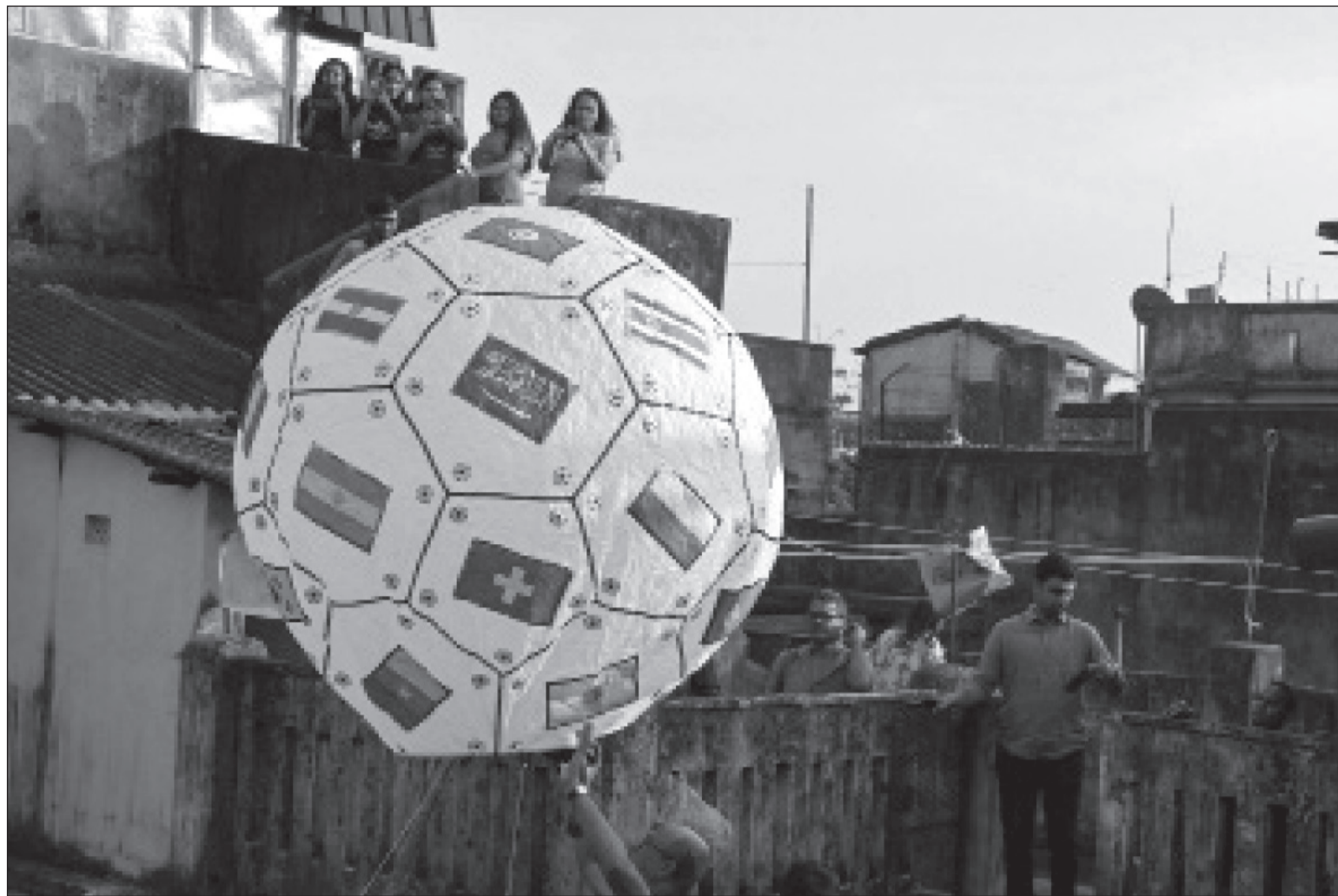
कतारले आयोजना गरेका फिफा विश्व कप फुटबल प्रतियोगिता मनाउन फुटबल समर्थकहरू फिफा विश्वकप फुटबल प्रतियोगिता मनाउन हस्तनिर्मित आकाश लालटेन जारी गर्दै।