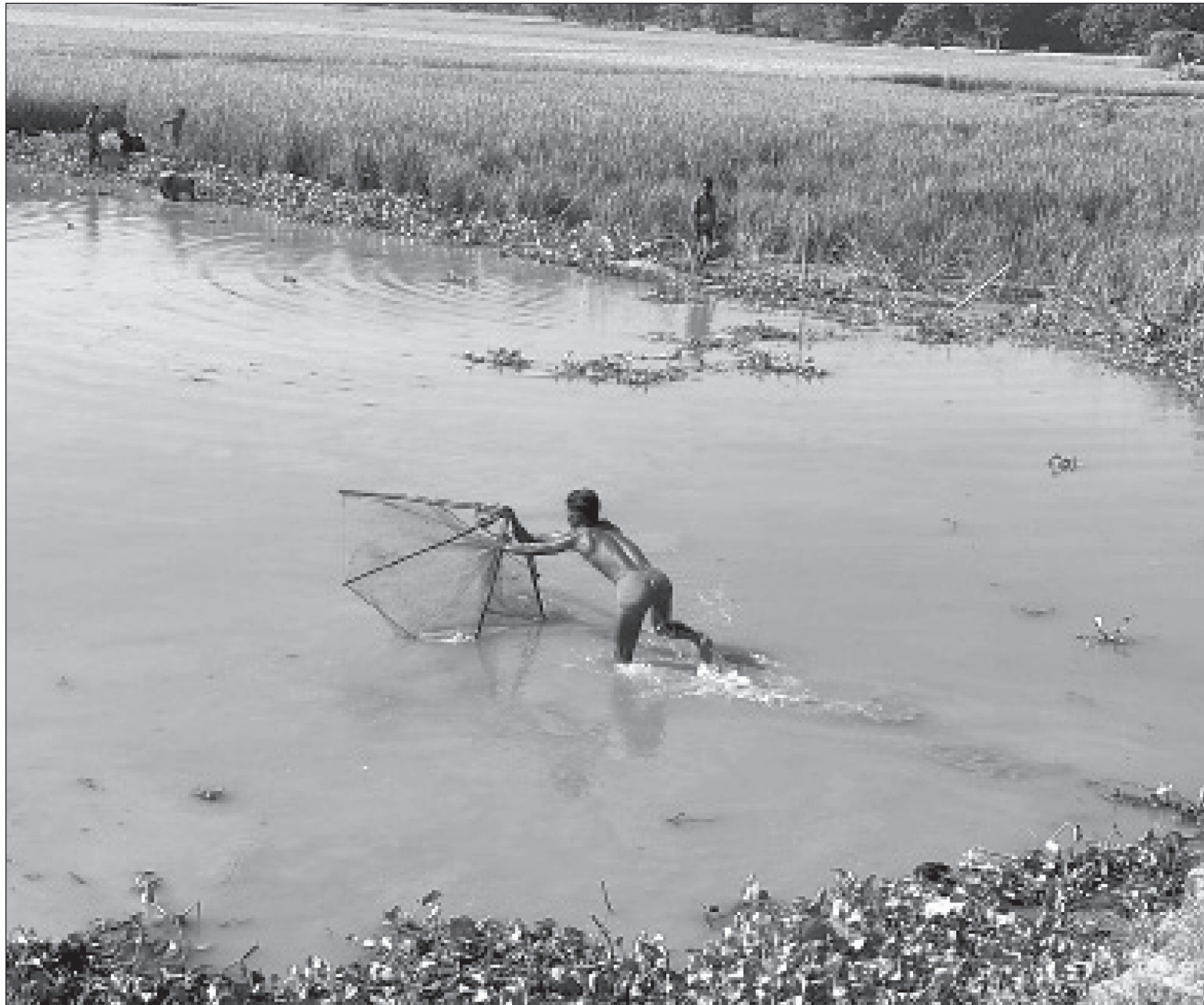
माछा माई : सप्तरीको तिलाठी कोइलाडी गाउँपालिकाको मनसापुरमा माछा माई माफ्री ।