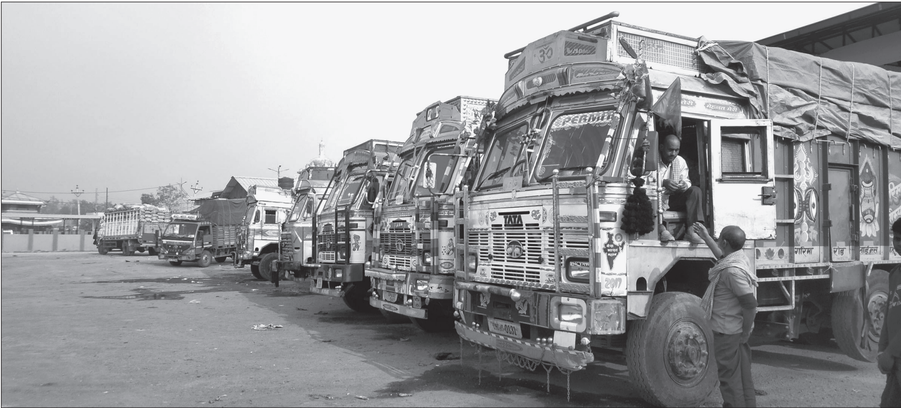
महोत्तरी जिल्लाको मुल भन्सार कार्यालय जलेश्वरमा भन्सार शुल्क बुझाउन लामबद्ध र प्रतिक्षामा रहेको भारतीय मालवाहक गाडीहरू ।