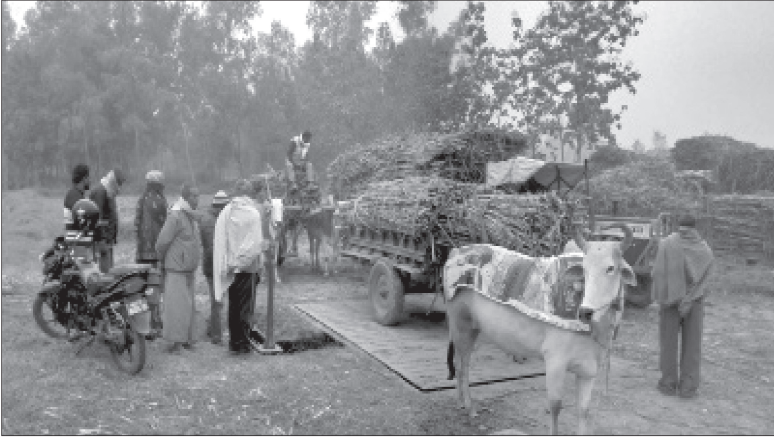
उखु तौल गर्दै किसान : महोत्तरीको भोलही गाउँमा उखु बेच्नु भन्दा पहिले उखु तौल गर्दै किसान ।