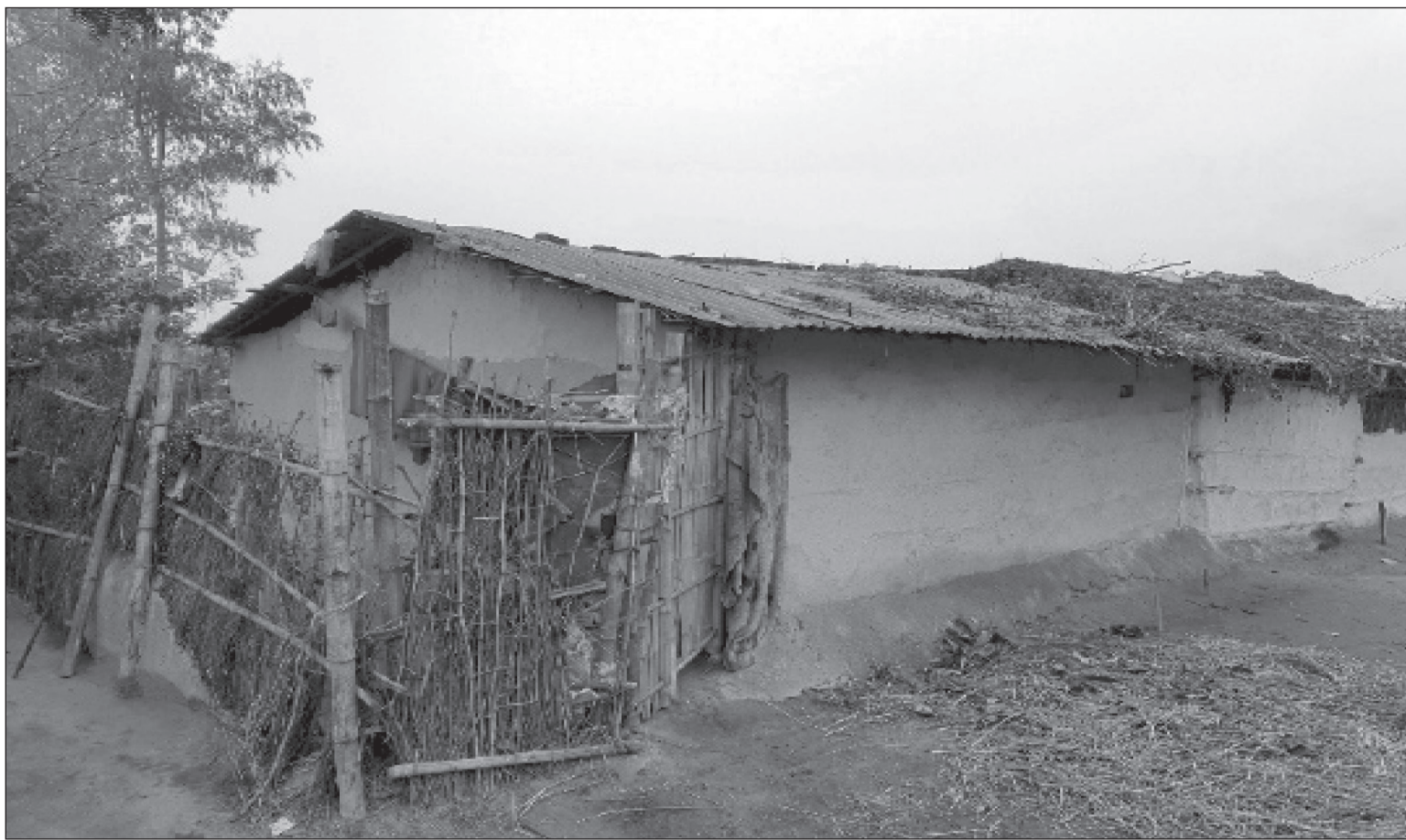
दलितको घर : जनकपुरधाम -२४ बसहिया स्थित दलित बस्ती