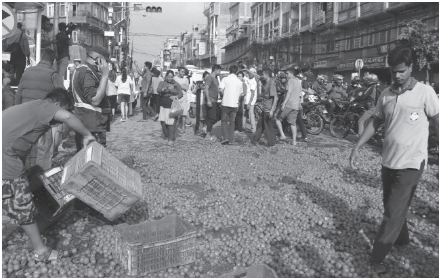
गोलभेंडाले उचित मूल्य नपाएको र बजारमा नबिकेको भन्दा किसानले आइतबार कालिमाटी तरकारी तथा फलफूल बजारको द्वार अगाडि सडकमा फालेको गोलभेंडा ।