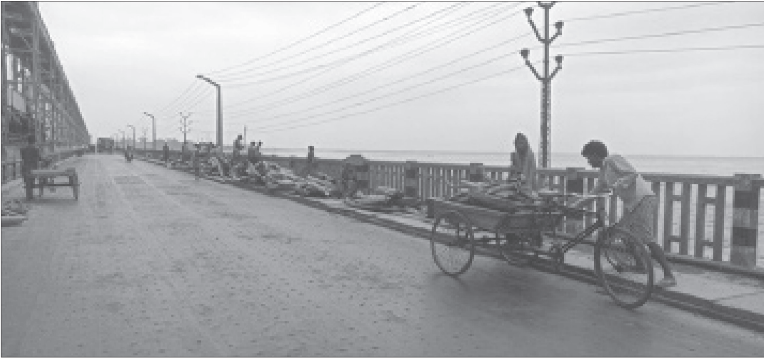
पहाडी जिल्लामा वर्षासँगै आएको बाढीमा सप्तकोशी नदीमा बगेर आएको काठ, दाउरा पुल क्षेत्रबाट जोखिम मोलेर फिकेपछि आइतबार घर तर्फ लौंदै स्थानीय ।