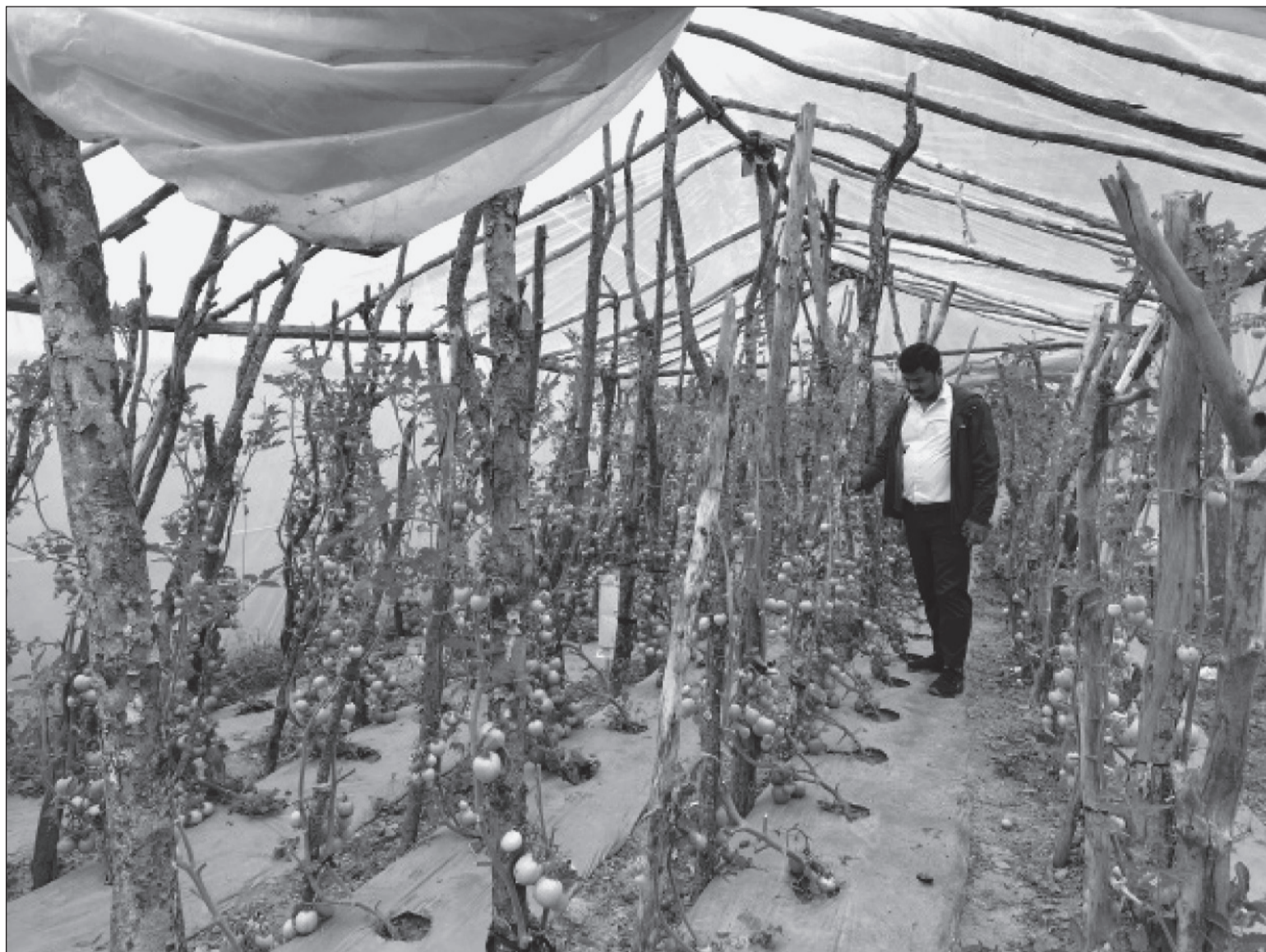
गोलभेडा खेतीको अनुगमन गर्दै जिल्लाका कृषि प्राविधिक। तरकारी खेतीबाट वार्षिक ४ लाख आम्दानी।