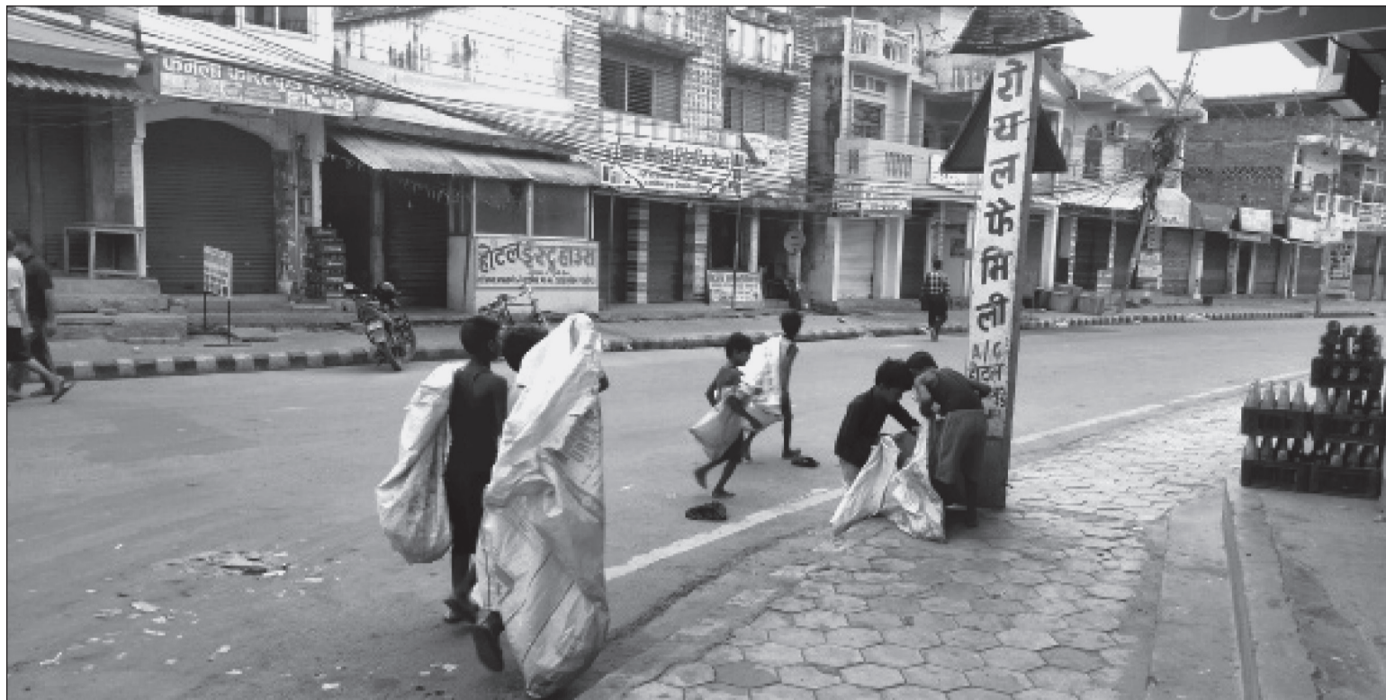
महोत्तरी जिल्लाको सदरमुकाम जलेश्वरमा सोमबार बिहानै कवाडी समान खोज्न हिँडेका बालबालिकाहरूको समूह।