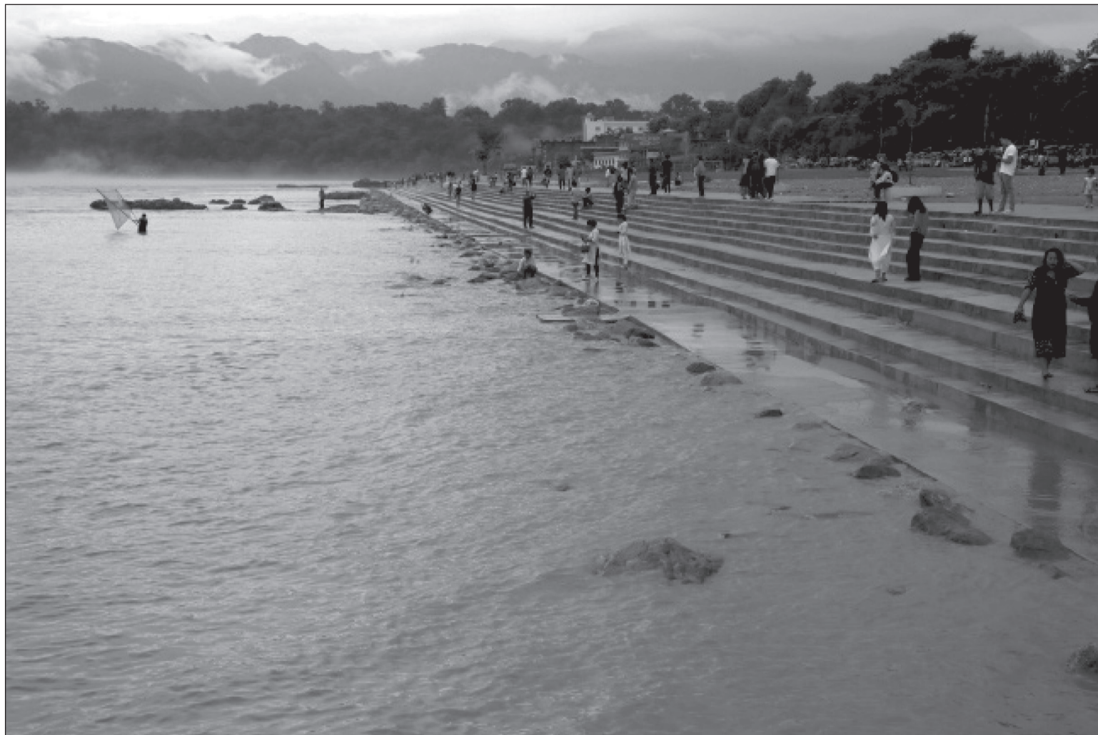
लगातारको वर्षाले बढेको नारायणी नदी र किनारमा सोमबार साँझ घुम्न आएका आन्तरिक पर्यटक। नदी किनारलाई रिभर विच मोडेलमा विकास गरेपछि यहाँ घुम्न आउनेको संख्या बढेको छ।