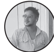
लेखक :- आयुब हुसेन

संसारको हरेक बिहान विस्तारै गएर एउटा सौम्य रूपान्तरित हुन्छ। बिहान उदाएको सूर्य सौम्य पर्दा अस्ताउने रित छ। यिनै दिन र सौम्यको क्रमसँगै जीवन बढ्दै गएर कहिले बुवा त कहिले छोरा, कहिले आमा त कहिले छोरीको भूमिका निर्वाह गर्ने क्रम चलिरहन्छ। त्यस्तै गुरु पूर्णिमामा गुरुको सम्झना गरियो, आमाको मुख हेर्ने दिन आमाको सम्झना गरियो भने कुशे औंसीका दिन बुवाको सम्मान, सम्झना अनि विशेष समर्पण गर्ने गरिन्छ। धेरैले आमालाई धर्तीसँग तुलना गरे। आमाको त्यागको व्याख्या गरे। आमाको ममताका बारेमा लेखे। तर, बुवाभित्र पनि मायाको विशाल खानी हुन्छ भने कुरा कमैले मात्र महसुस गरेका छन्। आमालाई धर्ती भन्दै गर्दा बुवाभित्रको आकाशजस्तै विशाल छाती किन नियाल्न सकेन? होलान कवि, कथाकारले? यो कुराले पनि मलाई बेला-बेला बुवाप्रतिको सम्मान भन्-भन्नु बढ्दै गएको आभास हुन्छ। हरेक सन्तानलाई भैँ मेरो मनमा रहेको बुवाप्रतिको सम्मान भावले आज उहाँकै निमित्त केही भावनाहरू शब्दहरू कोर्ने जमको गर्दैछु। हुन त बुवालाई सम्मान गर्न वर्षको एकदिन नै पर्युत्तुपर्ने त होइन, तथापि आजको दिनको पनि खास महत्व भएकाले मेरा केही शब्दहरू उहाँकै नाममा समर्पित गरेर यो दिनलाई थप महत्वपूर्ण बनाउन चाहें। मेरा लागि मेरो बुवा एक आदर्श पुरुष र प्रेरणाको स्रोत हुनुहुन्छ, जसको उपस्थितिले मात्रै पनि मभित्र जोस, जाँगर र आँटको बाढी नै ल्याइदिन्छ। जीवनको हरेक परिस्थितिमा एक सच्चा सल्लाहकारका रूपमा रही एकदमै सहज वातावरण निर्माण गरिदिने मेरा बुवा फरिस्ताभन्दा पनि उच्च आशानमा हुनुहुन्छ।