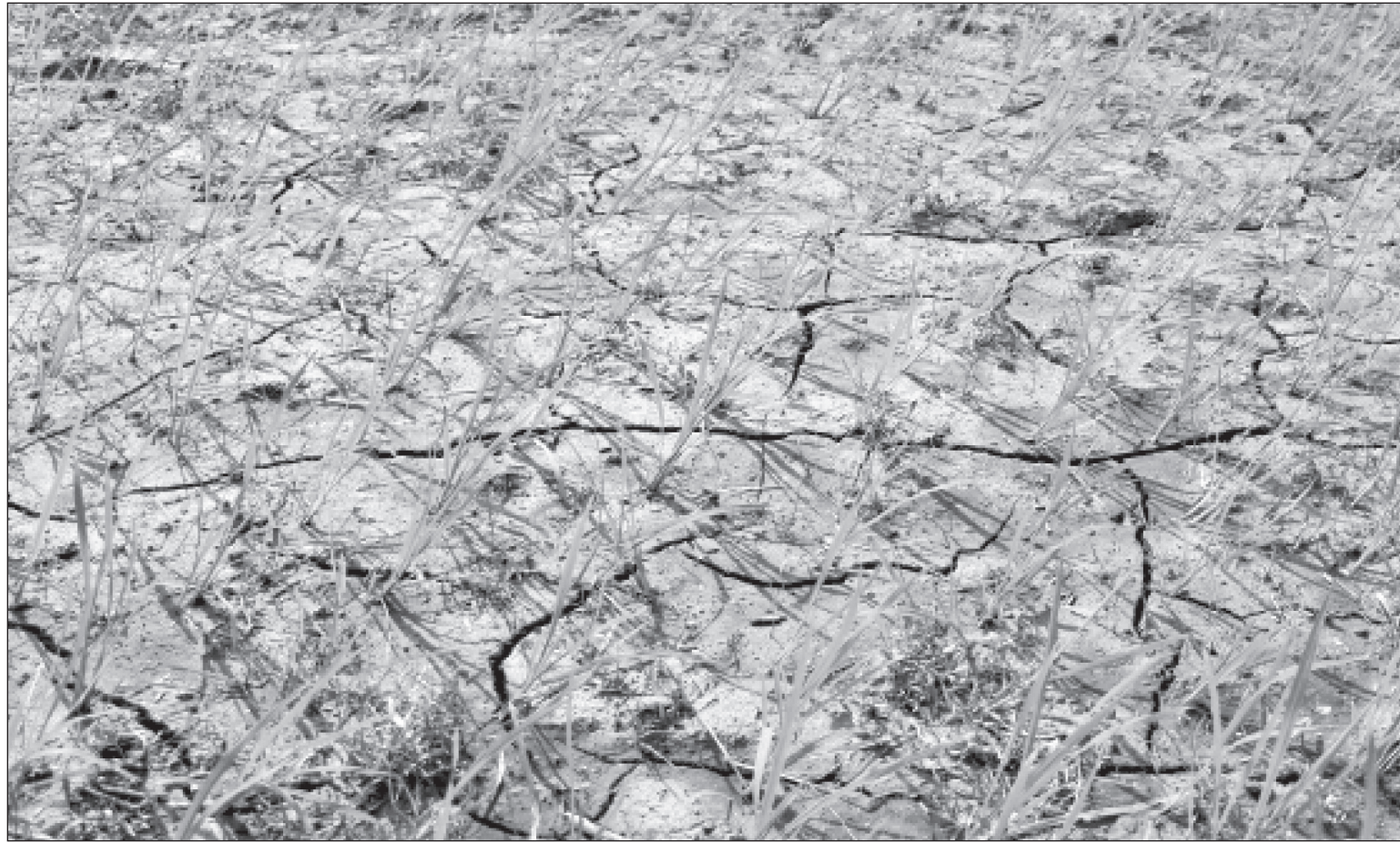
धनुषा लगायत मधेश प्रदेशका जिल्लाहरूमा पानी नपर्दा रोपिएको धान खेतमा धाँजा पर्न थालेको छ। धाँजा पर्दा यस पटक धान खेती कम हुने सम्भावना व्यक्त गरिँदैछ।