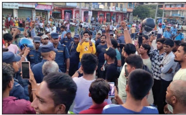
लापरवाहीले मृत्यु भएको भन्दै अस्पताल अगाडि शव राखेर प्रदर्शन गरेका थिए । परिवारजनले शव नबुझेर अस्पताल

जनकपुरधाम । उपचारको क्रममा मृत्यु भएपछि जनकपुरधाम उपमहानगरपालिकाको सुरक्षा अस्पताल अगाडि प्रदर्शन गरिएको छ । पाठेघर शल्यक्रियाको लागि पुगेकी ती महिलाको शुरुबार मृत्यु भएपछि प्रदर्शन गरिएको छ ।