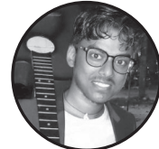
लेखक : आदर्श सिंह बटेश्वर गाउँपालिका, धनुषा

बिहान उठ्नु बित्तिकै खेत जाने हाम्रो काम हो यहि हाम्रो गान हो , त यहि हाम्रो दोकान हो खै ! किन सधैं हामिलाइ नै रुझाव्नु पर्छ कारण सायद यहि हो , कि हामी किसान हो किसान का लागि यो गर्थौं, सरकार को बखान हो नेताको काम बाट अहिले पनि हामी अन्जान हो कहिलै पनि हामी शान्त मनले काम गर्न सक्दैनौ कुरा मात्र यहि हो , कि हामी त किसान न हो न हाम्रा लागि उपहार , न त कुनै सम्मान हो आखिर जहाँ गए पनि हाम्रो अपमान हो कहिले मलको त कहिले सिचाइ को चिन्ता सधै दुःख भोग्नु पर्छ किनकी हामी किसान हो कोदालो लिएर काम गर्नु गरिब को पहिचान हो यहाँ त नामको लागि मात्र देश कृषि प्रधान हो घाम ,पानी भोक र तिर्खा भुल्ने त बानी नै भयो हाम्रो नभबिस्य नवर्तमान हो किनकी हामी किसान हो हिमाल, पहाड र तराई त भ्रम अन्को भन्डार हो आफु लाई किसान भन्नु चै यो देशमा मृत्युदान हो आफ्नो परिवार पनि पाल्न नसक्ने कस्तो अभागी हामी आज पनि पछाडी छौ किनकी हामी किसान हो