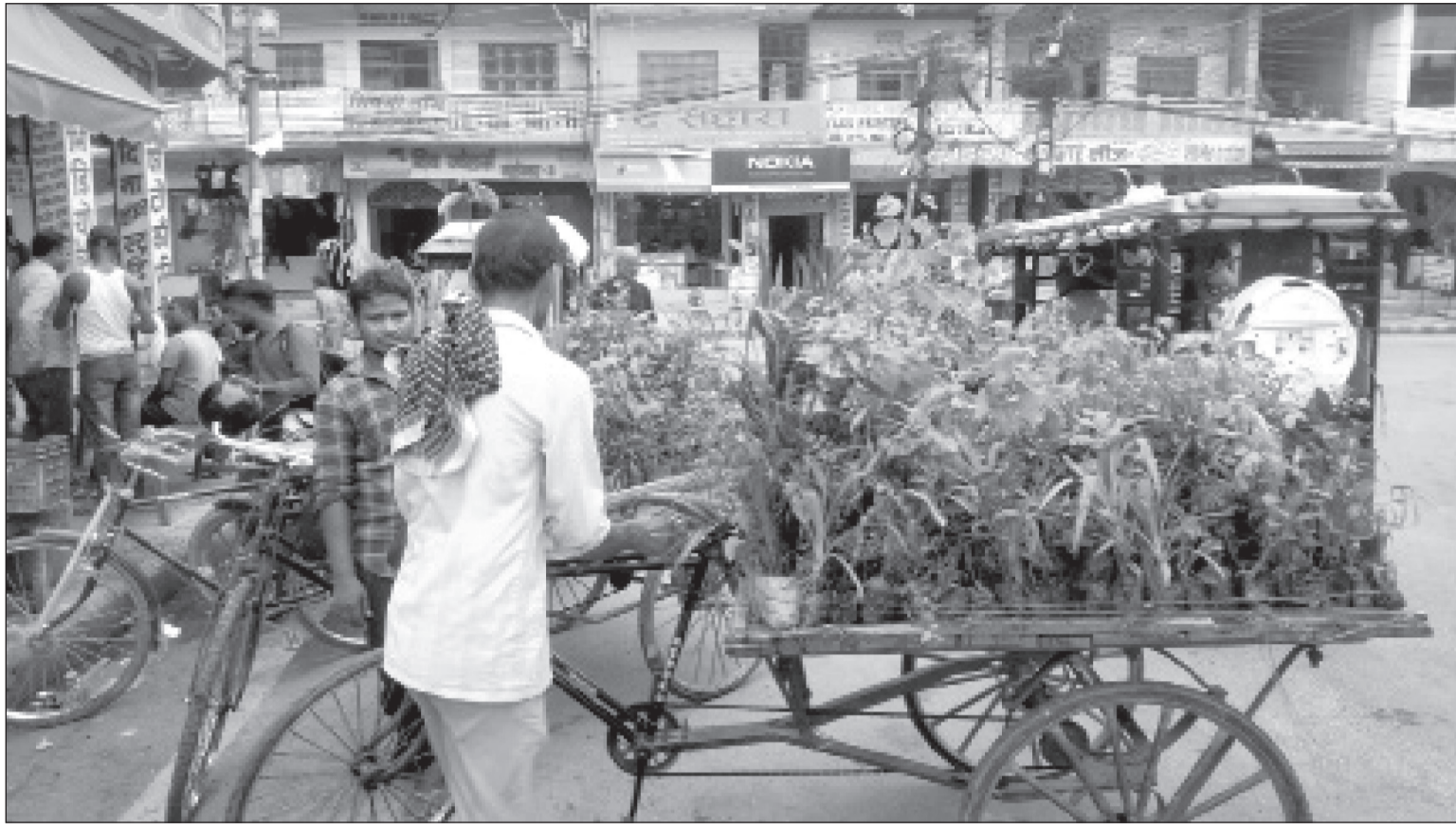
महोत्तरीको सदरमुकाम जलेश्वरमा ठेलागाडामा विभिन्न फलफूलका बोटाहरूवा बेच्दै ।