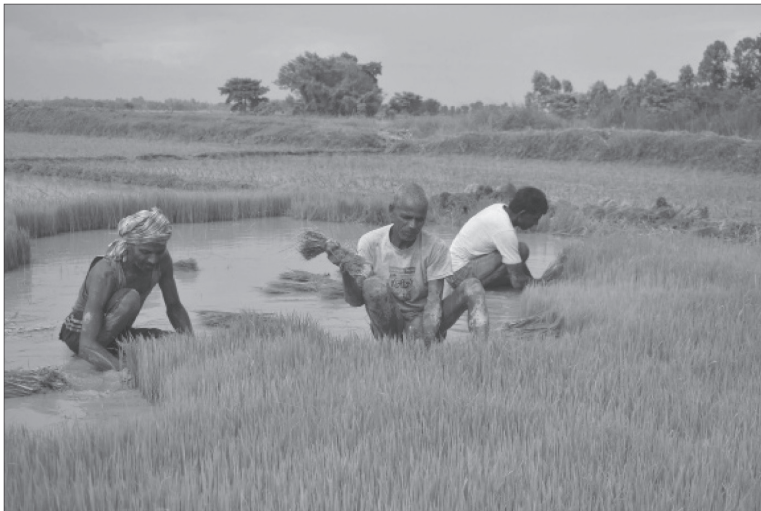
सुनसरीको इनरुवामा धान रोपलाई बिउ काड्दै किसान । साउनको पहिलो सातासम्म सुनसरीमा ७५ प्रतिशत रोपाईं सम्पन्न भएको कृषि ज्ञान केन्द्र सुनसरीले जनाएको छ ।