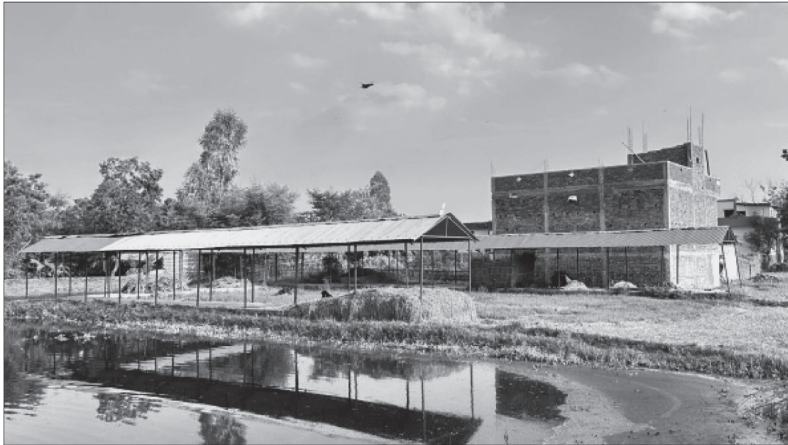
सर्लाहीको सदरमुकाम मलङ्गा नगरपालिका-६, खुट्टीनास्थित प्रयोगविहीन कृषि बजार सेड ।