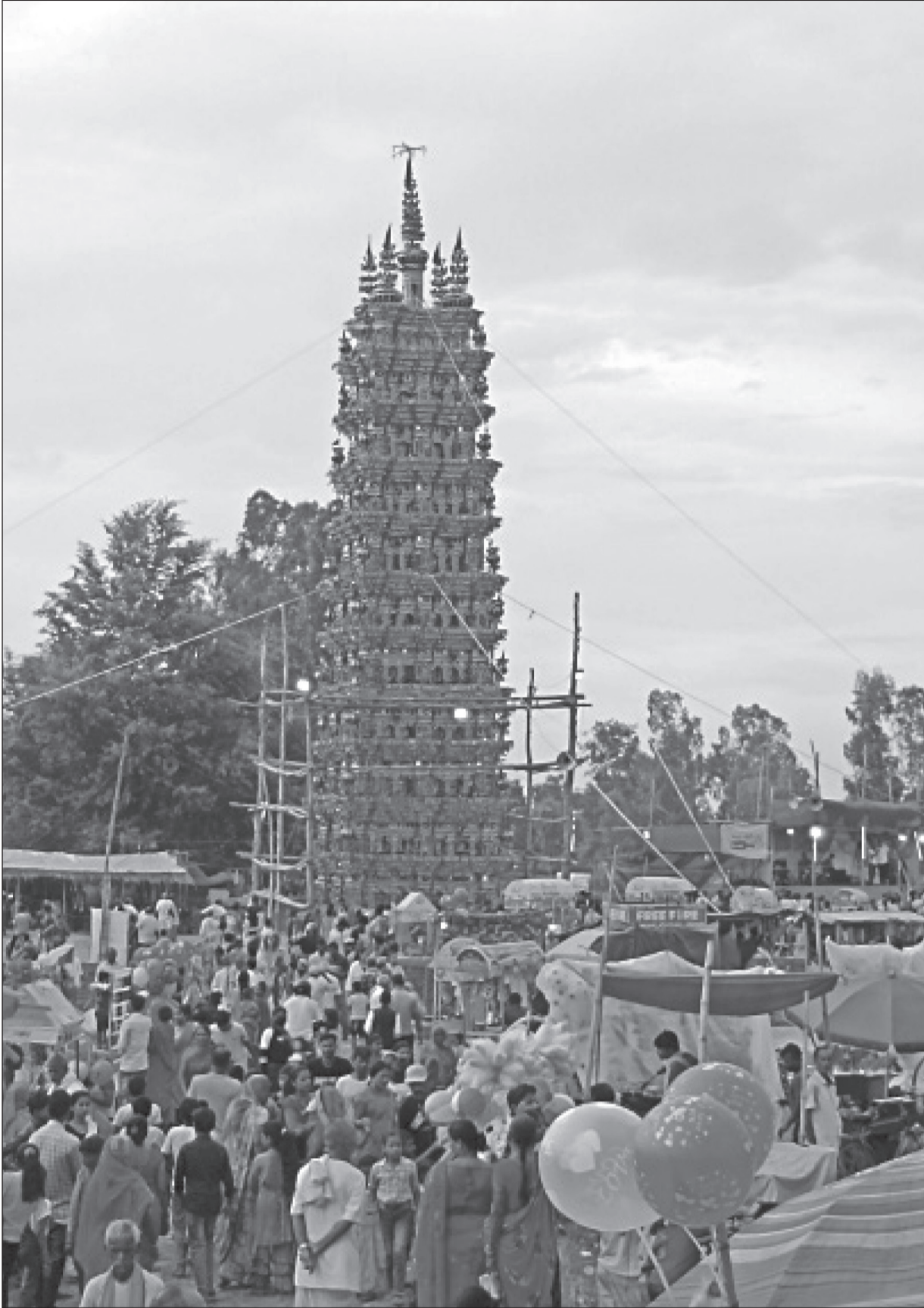
मुस्लिम समुदायले मोहरममा आयोजना गर्ने ताजिया (दाहा) मेलाको दोस्रो दिन शनिबार जनकपुरधाम उपमहानगरपालिका-२३ लादोबेलामा देखिएको रौनक ।

साथै उहाँले वन्यजन्तुको वासस्थानको राम्रो व्यवस्थापन गर्नसके वन्यजन्तु बाहिर ननिस्कने र स्थानीय बासिन्दालाई पनि वैकल्पिक आयको व्यवस्था गर्नसके जीविकोपार्जनका लागि जङ्गल जान बाध्य नहुने अवस्था बनाउन सरोकारवाला सबै लामुपर्मा जोड दिनुभयो । बाघलाई संसारभर प्रतीकात्मक प्रणीका रूपमा लिने गरिन्छ । प्राकृतिक सम्पदाका रूपमा रहेको बाघलाई सांस्कृतिक तथा ऐतिहासिक दृष्टिकोणले पनि महत्वपूर्ण मानिन्छ । जैविक प्रणालीलाई सन्तुलनमा राख्न पनि यसले योगदान पुर्याउँछ । खाद्य शृङ्खलामा बाघ मुख्य शिकारी वन्यजन्तु भएका कारणले अन्य जनावरलाई नियन्त्रणमा राखी वालावारा सन्तुलनमा यसको उत्कृष्टनीय योगदान हुन्छ । रासस