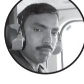
उदगार यादव मिथिला बिहारी नगरपालिका

अखनो विश्वास नै होए अही छी जिनगी कहूँ की तमाशा अहाँके