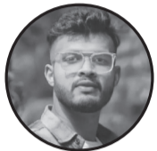
लेखक:- लकि प्लू.के प्रकाशन सहजीकरण:- रूपेश महतो ठेगाना:- माधवनारायण न.पा.-३ सखुअवा रौतहट

मायाको राग सगै सुभाष दिने यो जिन्दगी । पहाडका खोरिया सरी उजाड हुने यो जिन्दगी । । कहाँ बाट सुरु हुन्छ ? कहा छ ? गन्तब्य त्यसको । घिनाउने साथमा पनि उपहार हुन्छ जिन्दगी ॥ जिउनु पछि बाध्यताले २ दिन हो जस्तो लाग्छ मलाई । नदिको भेल सरी उल्टिने हो यो जिन्दगी ॥ खोज्छ सधै उन्नती अनि प्रगतिका लहरहरु । तर पाइदैन शही बाटो धिक्कार लाग्छ जिन्दगी ॥ दुःख र सुखको सडगम लिएर सधै साथमा । को हुन्छ र भव बुज्ने रोदन होकी लाग्छ जिन्दगी ॥ भन्छ सधै यो मन आफ्नो सम्भन्ध कसैलाई । खडा हुन्छ तरबार त्यहाँ कस्तो हुन्छ त्यो जिन्दगी ॥ अतित र वर्तमान सगै खोज्दै हिंड्ने ति बाटाहरु । मेरे गरे पनि पुरा न् हुने जिन्दगी ॥