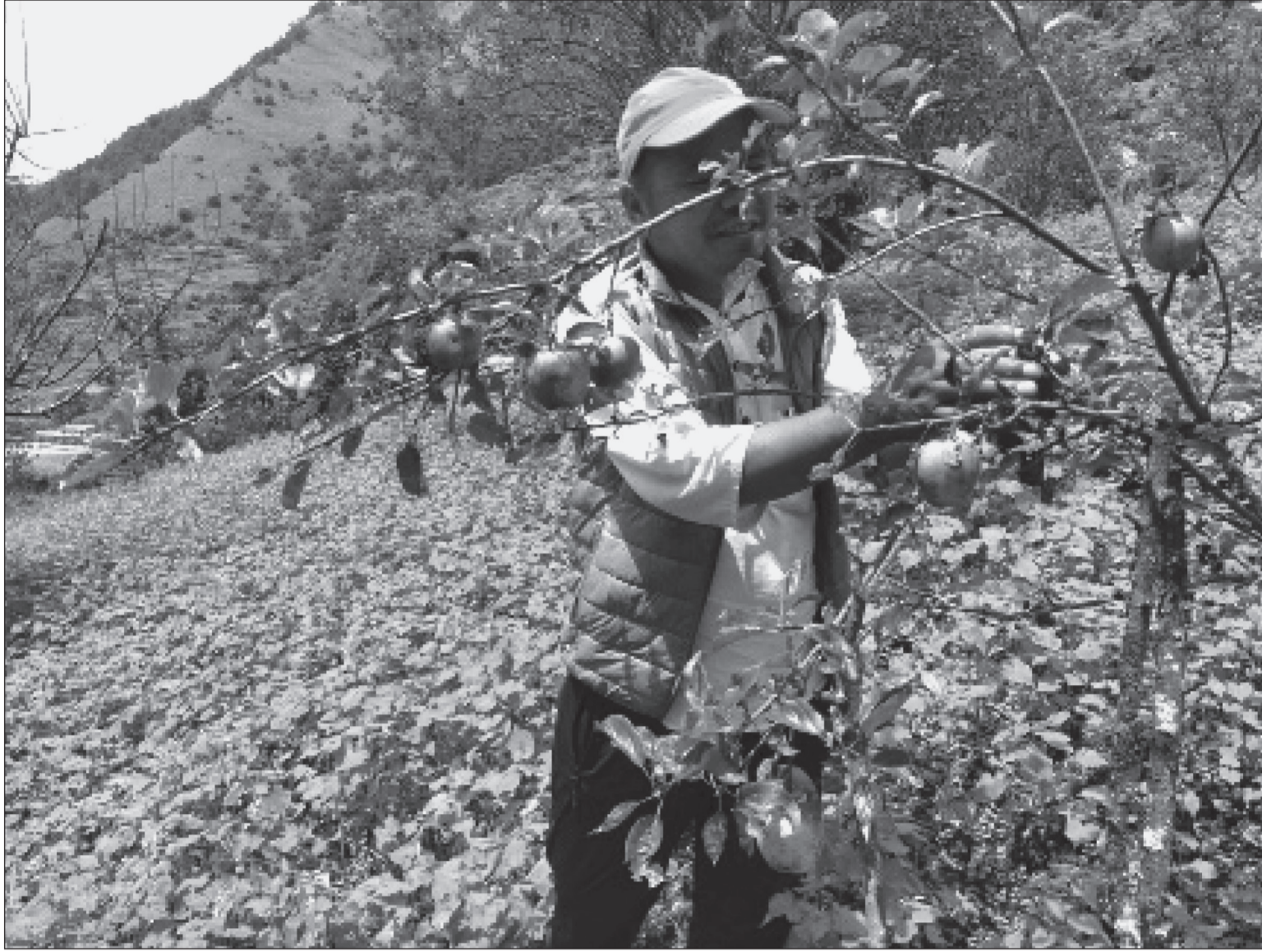
धवलागिरि गाउँपालिका-१ गुर्जामा उत्पादन भएको उच्च घनत्व जातको स्याउ। गुर्जामा जिल्लामै पहिलोपटक परीक्षणका लागि गरिएको उच्च घनत्वको स्याउ खेतीको परीक्षण सफल भएको छ। तरिवर : रासस