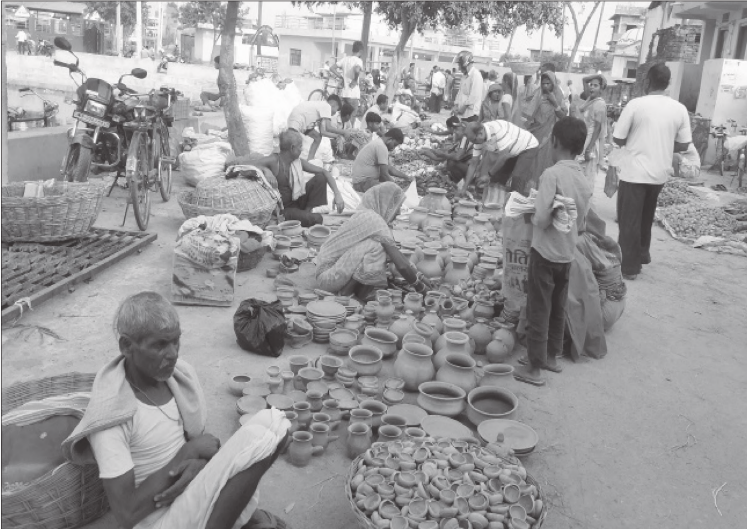
दसैं सकिए लगते दीपावलीका लागि महोत्सवीको सदरमुकाम जलेश्वर नगरपालिका-१ मा रहेको हटिया बजारमा बिक्री गर्न राखिएको माटोको भाँडाकुँडा ।