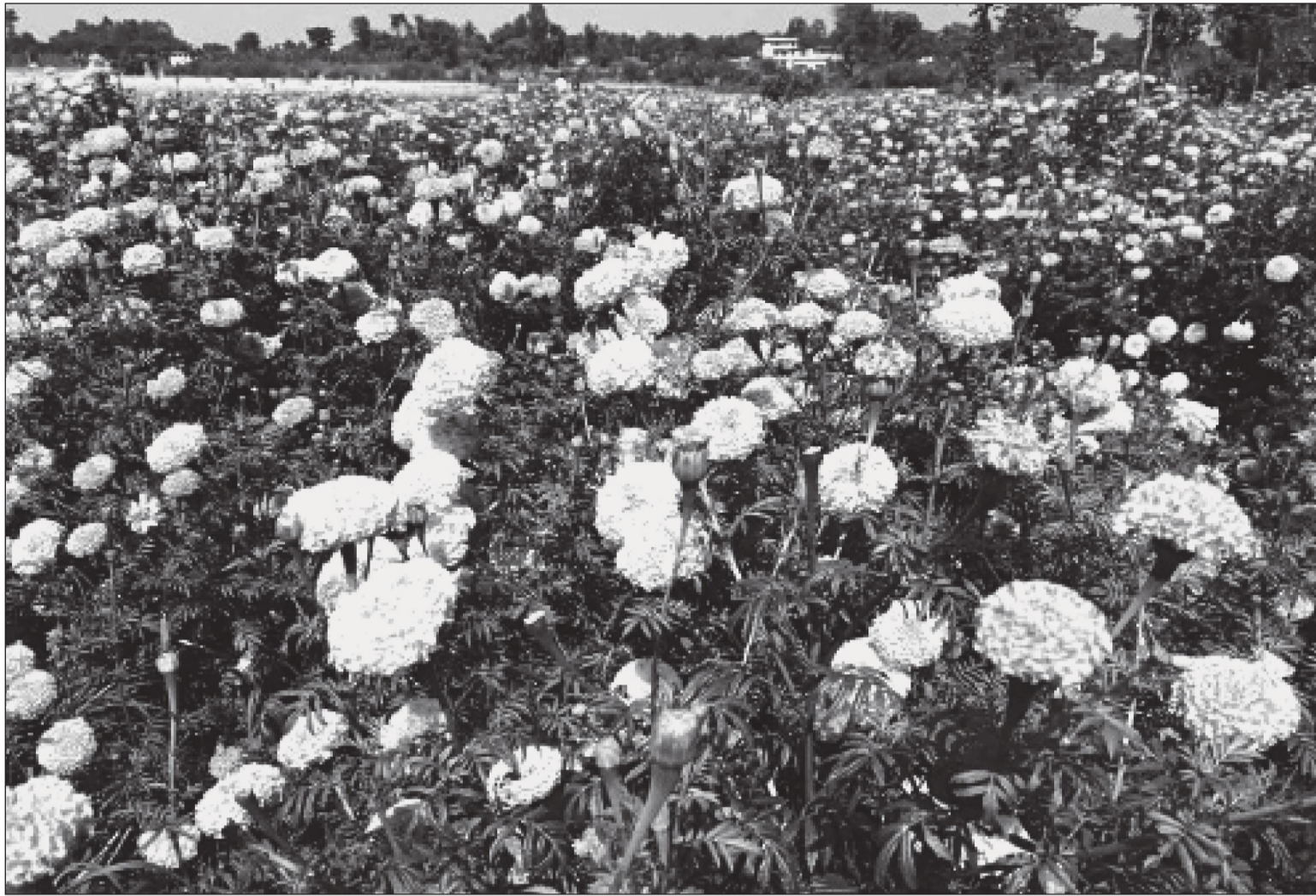
मोरङको सुन्दरहाँचा नगरपालिकाको गोठगाउँस्थित कादम्बिनी कृषि सहकारी संस्थाले व्यावसायिक रूपमा गरेको फूलखेतीमा ढकमक फुलेको सयपत्री फूल।