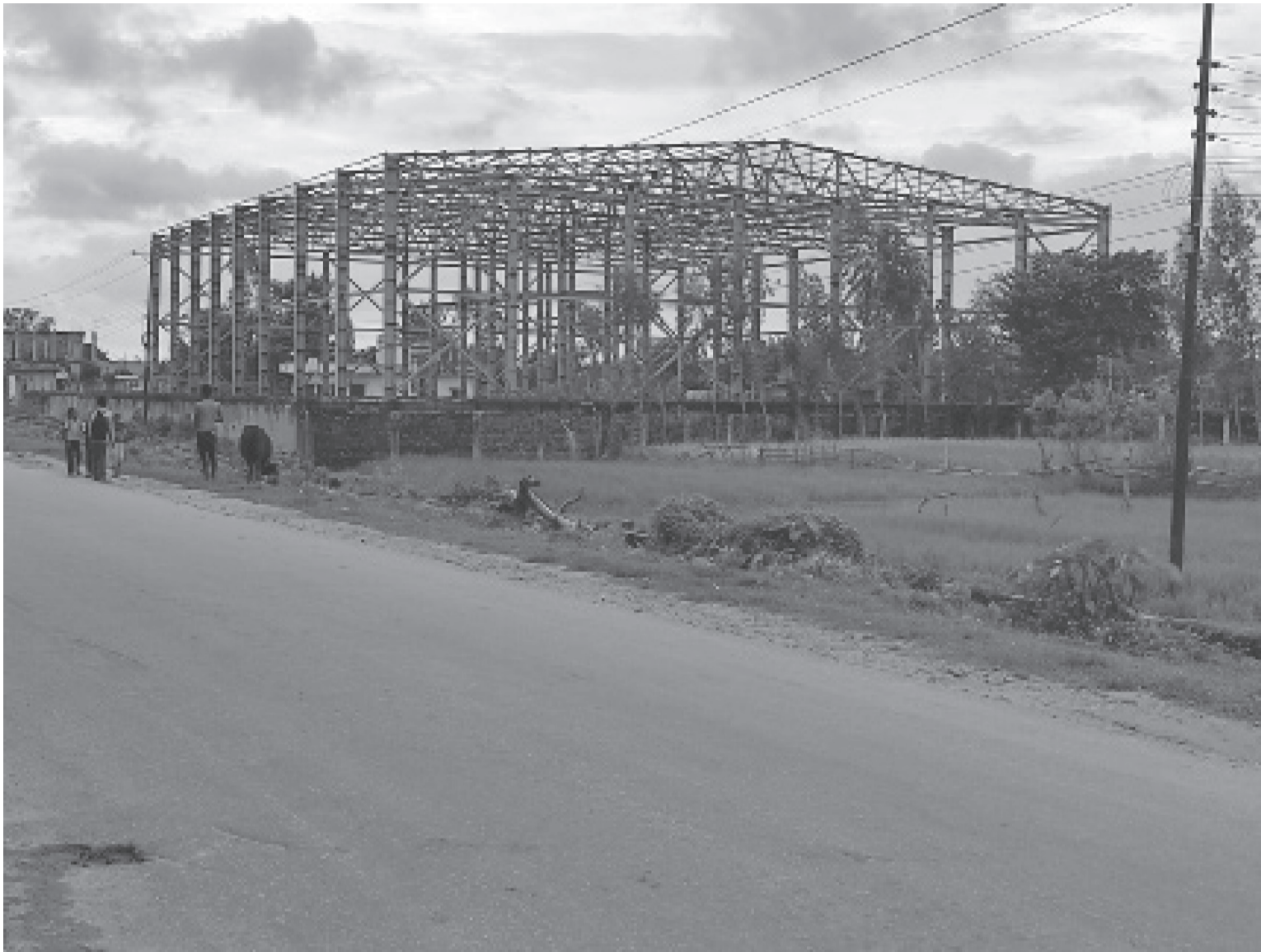
कृषि उपज खेर जाने समस्या सामाधान गर्न सप्तरीको राजविराज नगरपालिका-१५, देउरी भ्रुवामा निर्माण थालिएको सहकारी शीतभण्डार (कोल्ड स्टोर) अहिले अलपत्र अवस्थामा। निर्माणधीन सहकारी शीतभण्डार तीन वर्षअगाडि बजेट अभावका कारण निर्माण कम्पनीले काम छाडेका छन्।