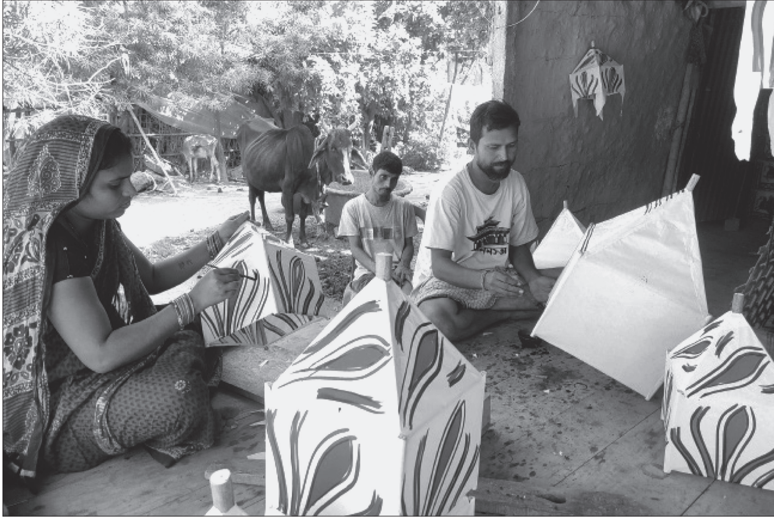
दसैँ सुरु भएसँगै दसैँ खर्च जुटाउनका लागि सप्तरीको हनुमाननगर कंकालिनी नगरपालिका-९, हनुमाननगरमा शुक्रबार मिथिला संस्कृति अनुरूप बनाइएको भाँप रङ्ग लगाउँदै माली समुदायका कारिलगढ । रु दुई सयदेखि रु तीन सय सम्ममा विक्री भइरहेको भाँप दसैँ तिहारमा, मठमन्दिर र कुलदेवतालाई चढाउने गरिन्छ ।