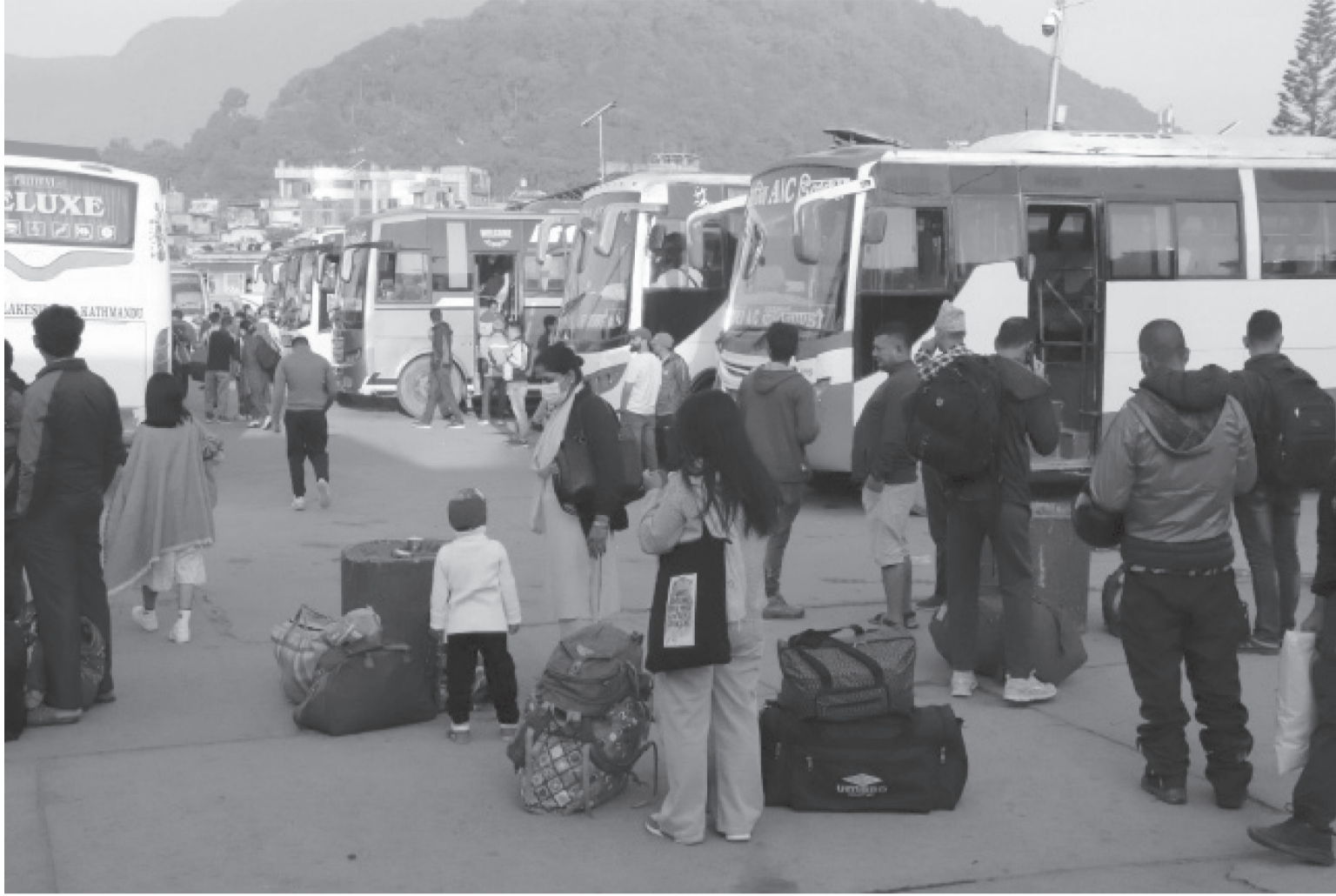
दसै मनाउनका लागि घर जान बडादसैको सप्तमीका दिन बिहान काठमाडौंको गोगुंस्थित नयाँ बसपार्क आएका सर्वसाधारण ।