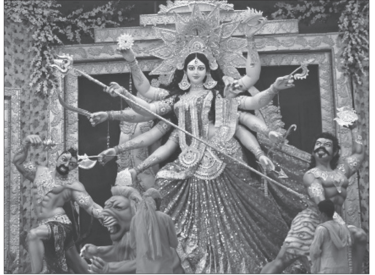
महोत्तरी जिल्लाको मटिहानीमा माँ दुर्गा भवानीको माटाले बनाएको कलात्मक मूर्ति ।