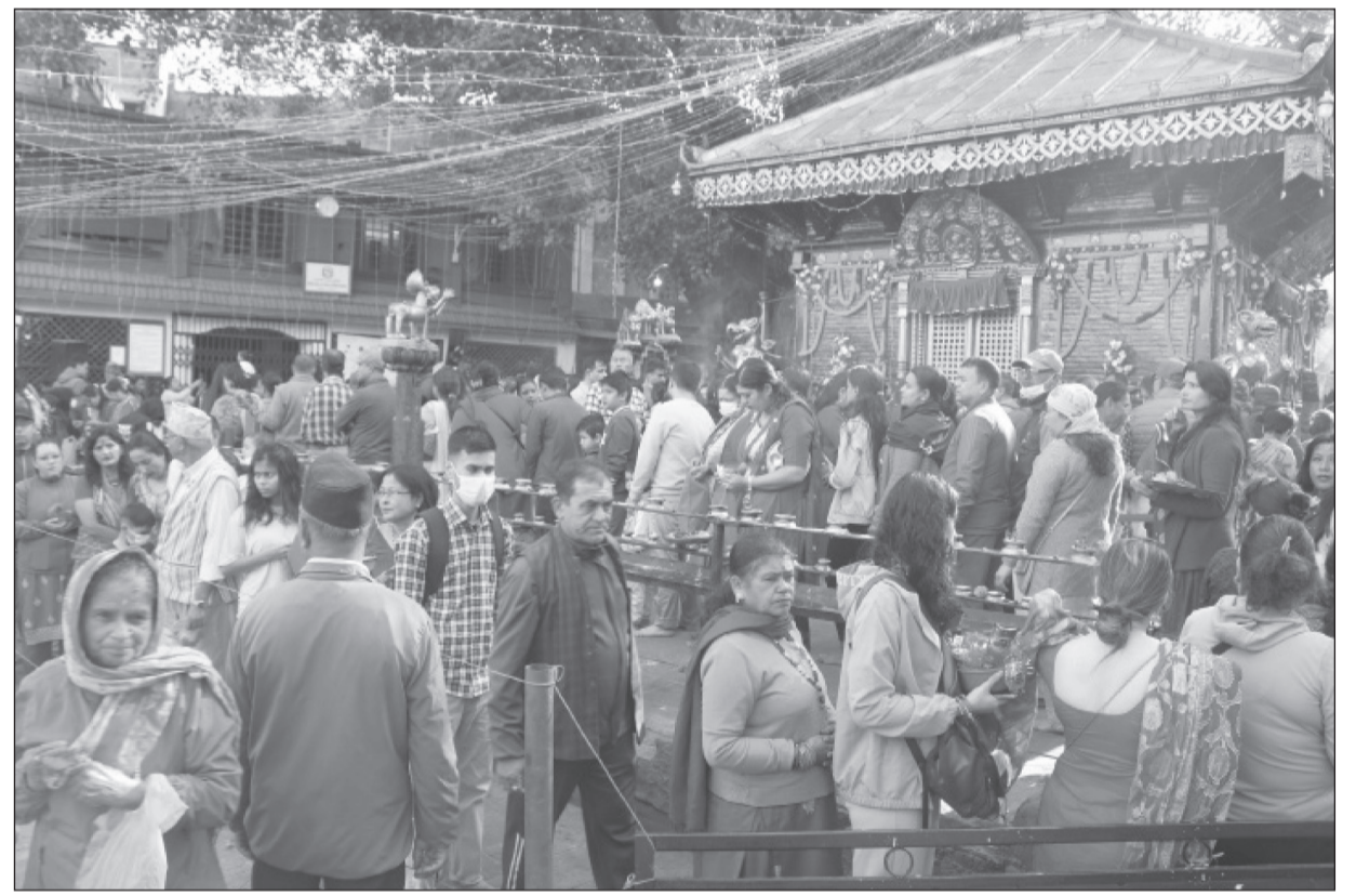
नवरात्रको सातौँ दिन अर्थात फूलपातीका दिन काठमाडौँको मैतीदेवी मन्दिरमा पूजा आराधना गर्न लामबद्ध भएका भक्तजन ।