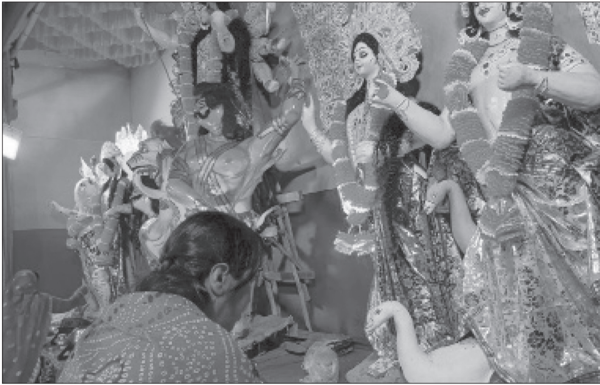
दमक युथ क्लबले दसैँका अवसरमा स्थापना गरेको दुर्गा पूजामा शनिबार मूर्ति अनावरणपछि पूजा गर्दै धर्मावलम्बीहरू ।