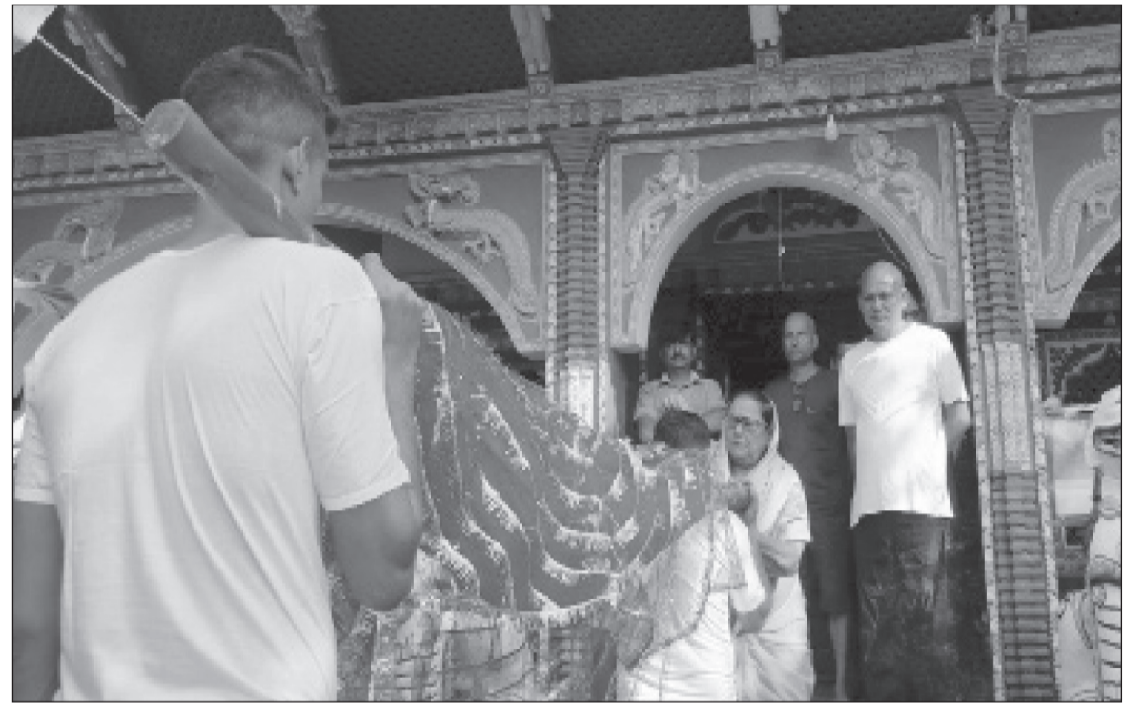
सुनसरीको इनरुवा-९ स्थित भगवती मन्दिरमा बडादसैँको सप्तमी दिन शनिबार फूलपाती भित्त्याइँदै ।