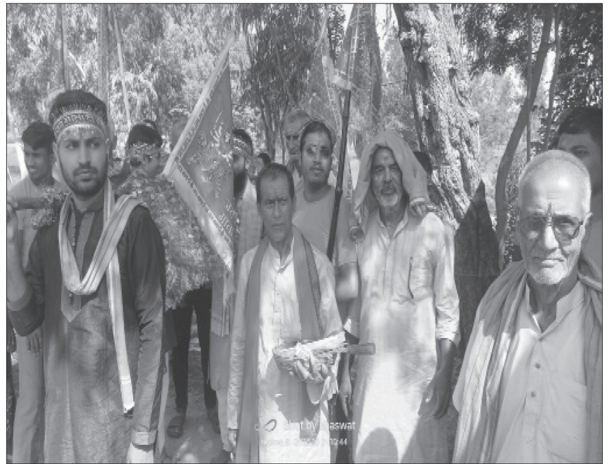
बेलनीती गर्न पुगेका पुरोहित सँगै श्रद्धालुहरू ।