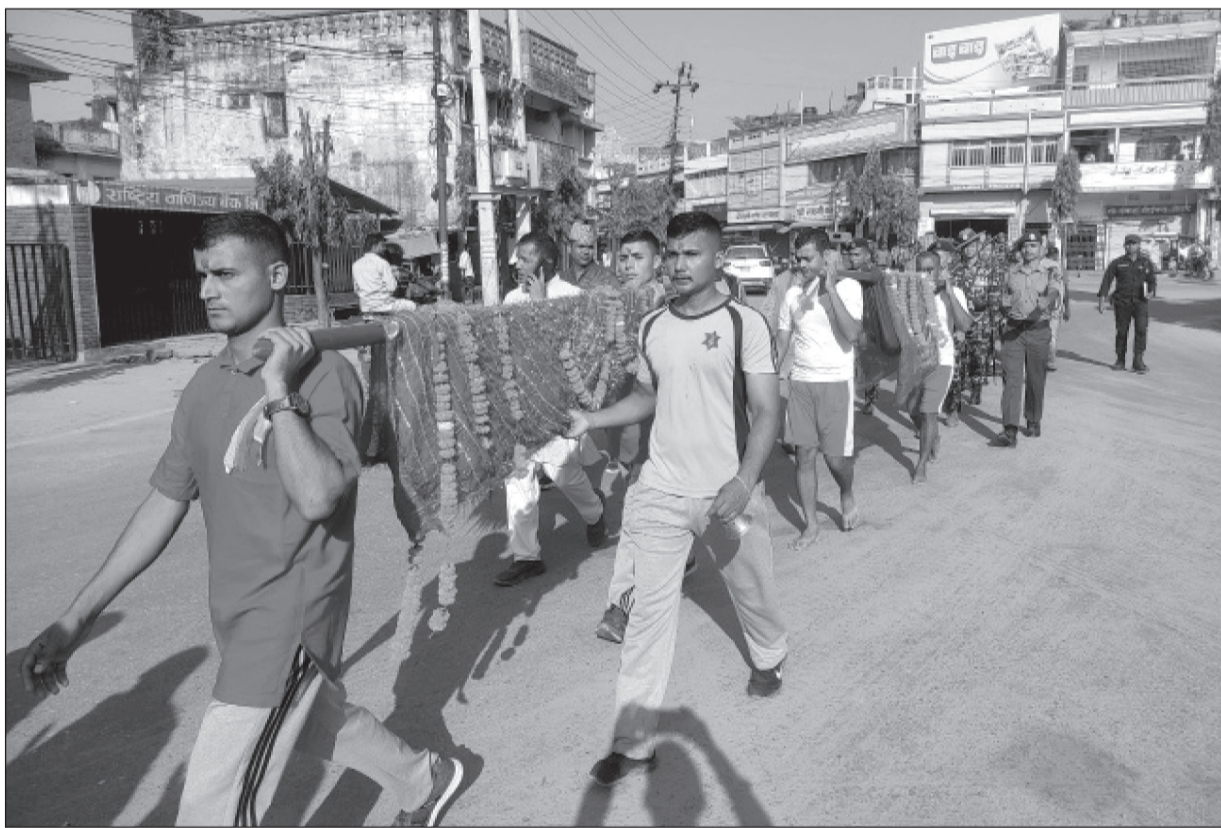
सप्तरीको राजविराजमा भगवती मन्दिरबाट फूलपाती भित्त्याउँदै नेपाली सेना ।