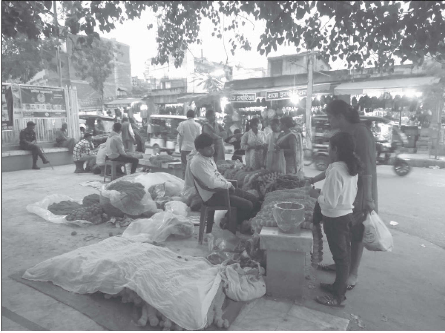
जनकपुरधामको जनक चौकमा सयपत्रीको माला बिक्री ।