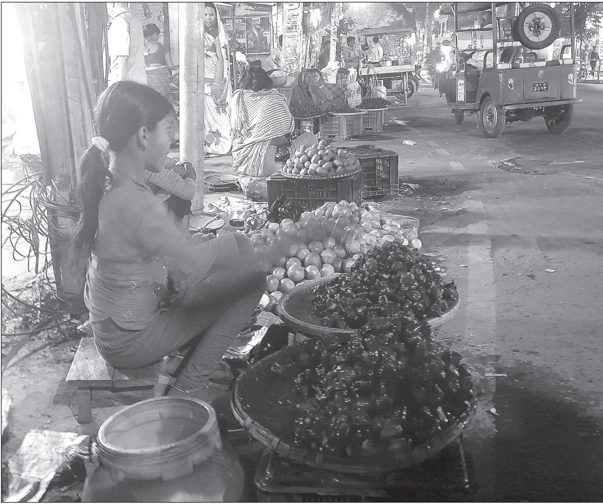
जनकपुरधामको शिवचौकमा सिंघारा बेच्दै बालिका ।