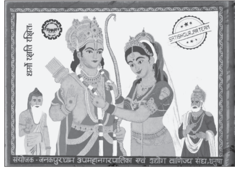
परिचयलाई बिश्वजगतमा फैलायो ईतिहास यो यात्रामा कदम नडगमागइ अगाडी रच्यो हामी केवल वहाहरुको साथमा साथ बढ्यौ र रामजानकी प्रतिमाले बिश्वरेकर्ड