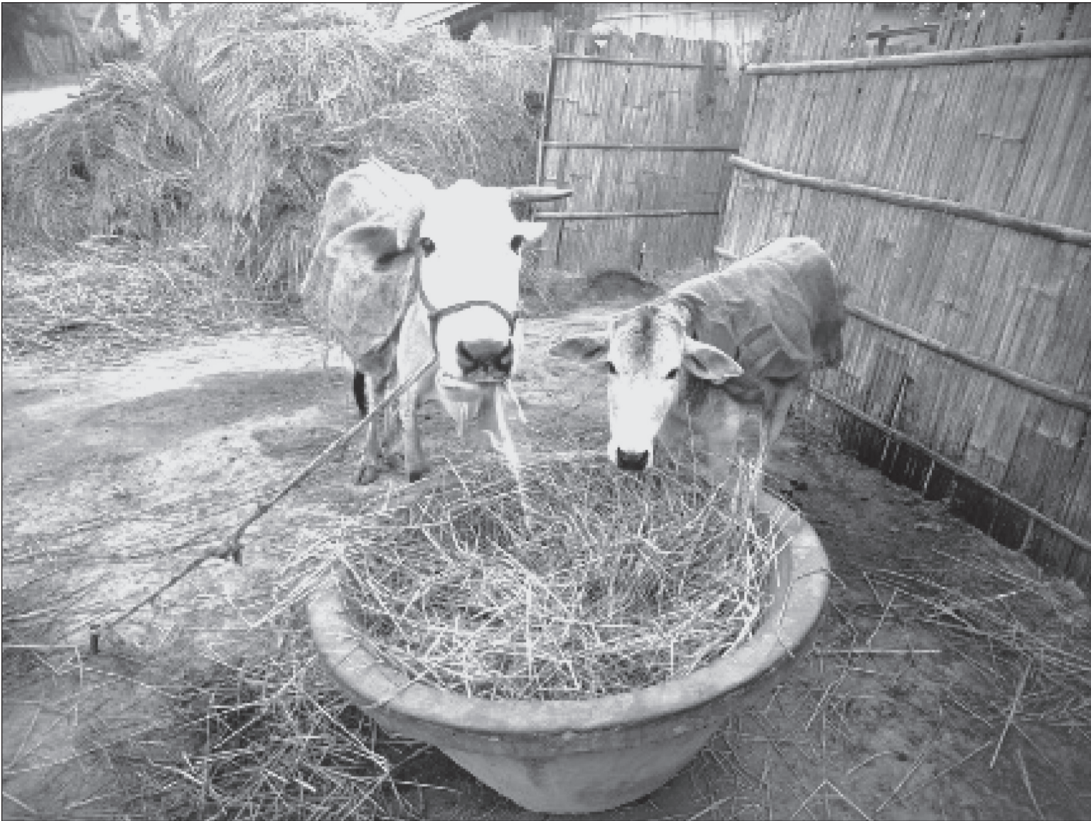
सुनसरीको इनरुवा-४ मा जाडो बढेसँगै पशुचौपायालाई बोरा लुगा बनाएर बडाइदिँदै। केही दिनदेखि जाडो बढेकाले जनजीवन प्रभावित भइरहेका छन्।