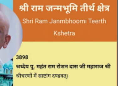
श्री राम जन्मभूमि तीर्थ क्षेत्र

तर यसो भनि रहँदा जानकी मन्दिर कुनै निकाय, व्यक्ति वा संस्था विशेषको एकल वचस्व कायम हुन सक्दैन । यो विश्वका करोडौं सनातन धर्माबलम्बीहरूको साभामा आस्थाको केन्द्र हो । धार्मिक, ऐतिहासिक तथा पुरातात्विक पर्यटनमा रुचि राख्ने तथा यस्ता संरचनाहरूको संरक्षण गर्न सघाउने संघ संस्थाहरूको पनि साभामा सम्पदा हो । साभामा संस्थाको व्यवस्थापनमा रुचि लिनु, राम्रा पक्षको समर्थन गर्नु अनि नराम्रा पक्षको विरोध गर्नु सबैको अधिकार हो । कारण यो सम्पदा सबैको साभामा हो । महन्त, पुजारी वा साधु सन्तमात्रको होइन तर पछिल्लो