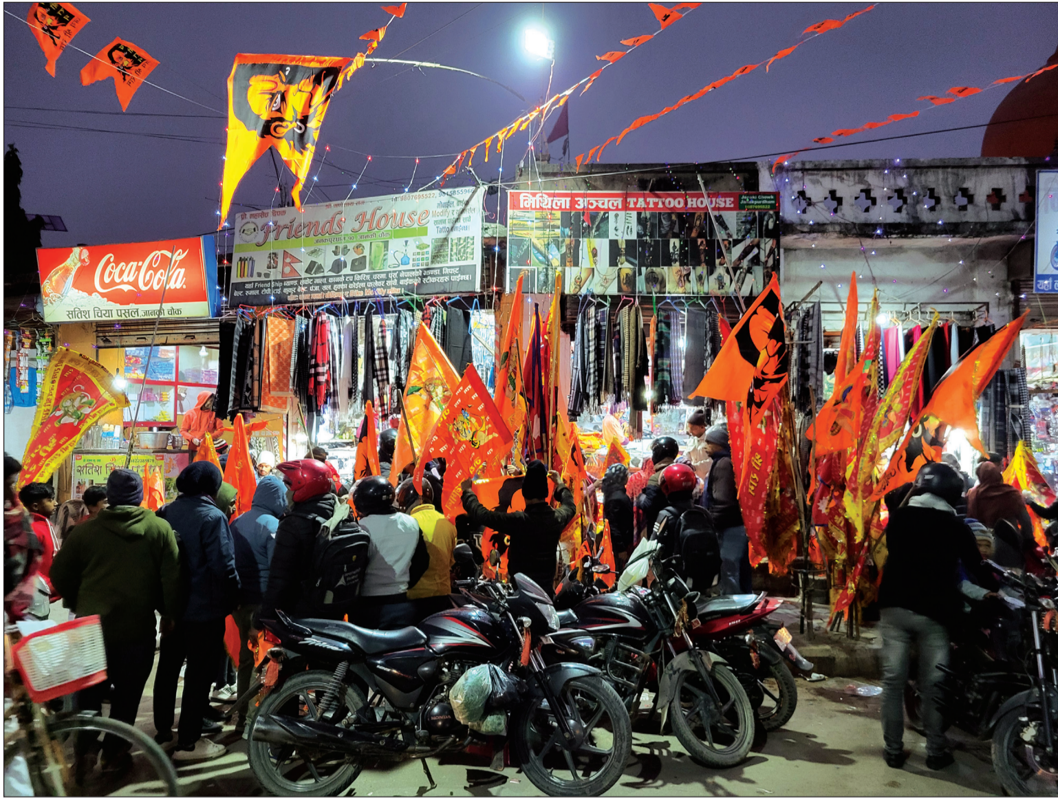
सोमबार भारतको अयोध्यामा भगवान रामको प्राण प्रतिष्ठा हुने अवसरलाई मध्य नजर गर्दै उत्सव मनाउन जनकपुरधाममा घर घरमा भगवान राम र हनुमान इन्ड्रिजित ध्वजा लगाउनकालागि ध्वजा फिन्नेको घुईंको।