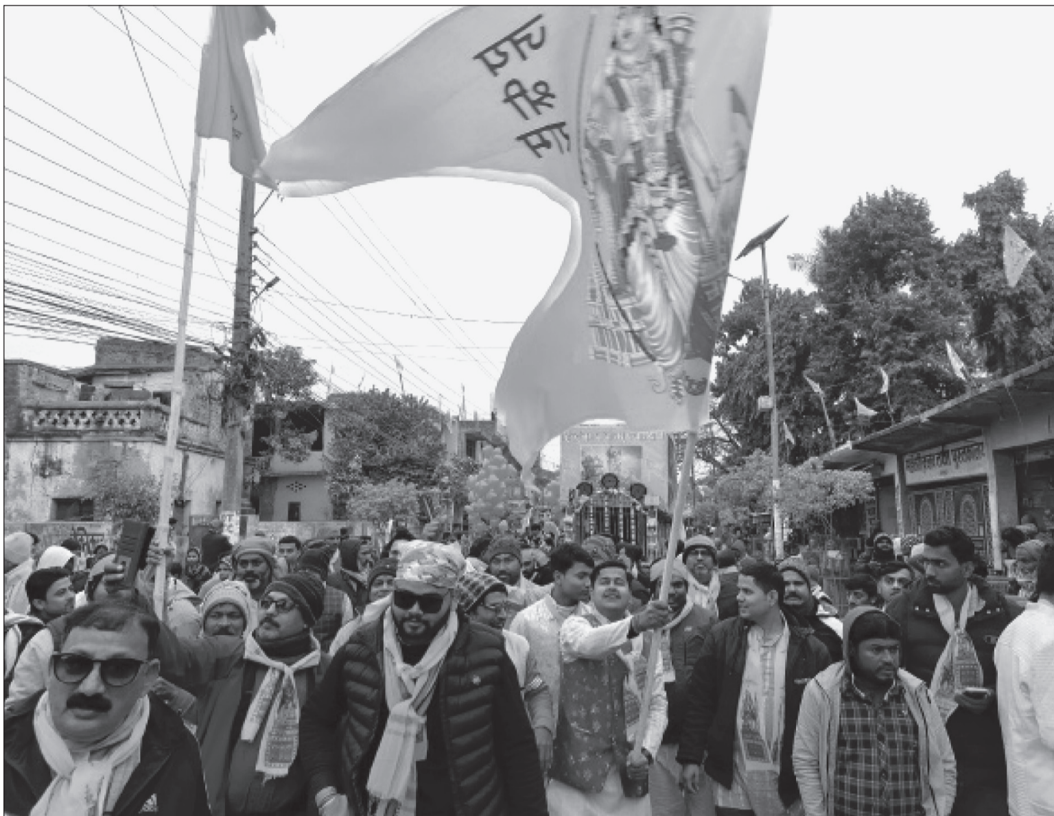
भारतको अयोध्यामा माघ ८ गते हुन लागेको भगवान रामललाको प्राण प्रतिष्ठा कार्यक्रमको पूर्वसन्ध्यमा आइतबार महोत्तरीको सदरमुकाम जलेश्वरमा आयोजित रामसीता शोभा यात्राका सहभागीहरू।